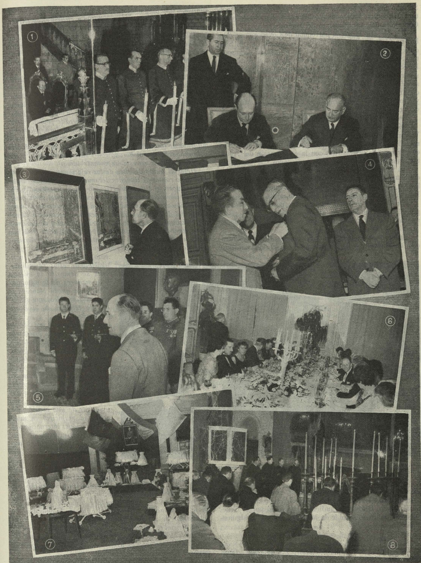
1. Los Maceros del Ayuntamiento durante la misa dedicada al Santo Angel de la Guarda.—2. El Ministro de la Vivienda, señor Arrese, y el Alcalde, Conde de Mayalde, firman el convenio de cesión de mil viviendas al Ayuntamiento.—3. El Alcalde inaugura la Exposición de Planos de Madrid de los siglos XVII y XVIII.—4. Momento de imponer la Medalla de Oro de la Sinfónica al señor Soler.—5. Los socorristas náuticos recibidos por el Conde de Mayalde. 6. Aspecto del salón-comedor durante la cena ofrecida al Delegado de las Naciones Unidas, doctor Mario Amadeo.—7. Exposición de Canastillas en la Tenencia de Alcaldía de Tetuán de las Victorias.—8. Funeral celebrado en sufragio del que fué Subdirector de la Empresa Municipal de Transportes.