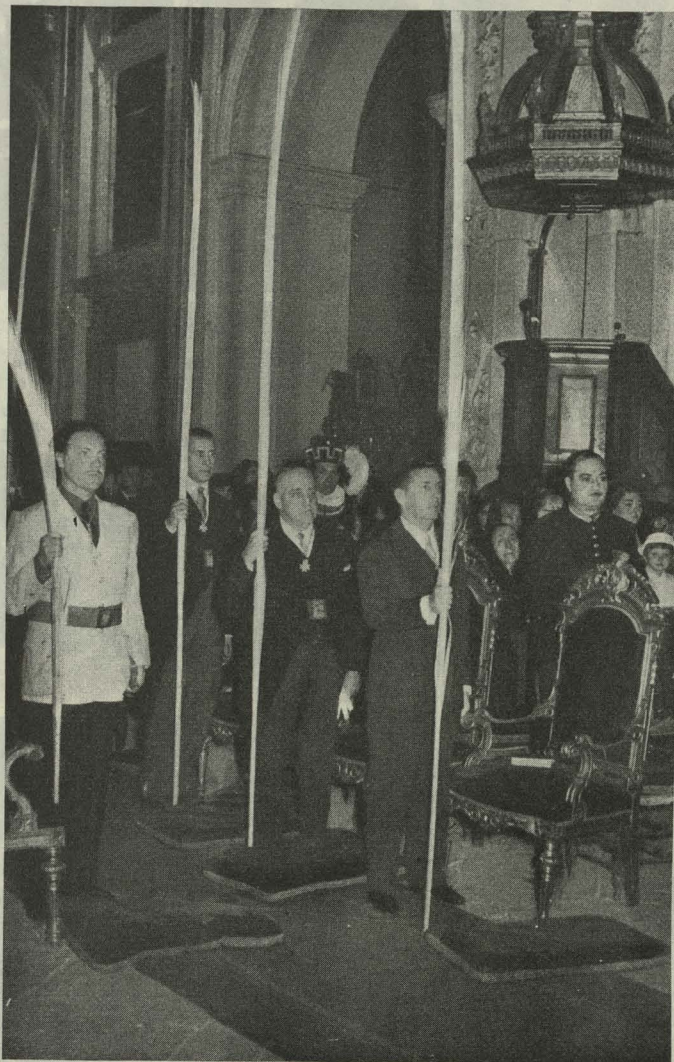
La Corporación Municipal en la misa del Domingo de Ramos

Día 13. —En Málaga desfiló procesionalmente la Cofradía de Nuestro Padre Jesús de la Puente del Cedrón y María Santísima de la Paloma, de la que es Hermano Mayor