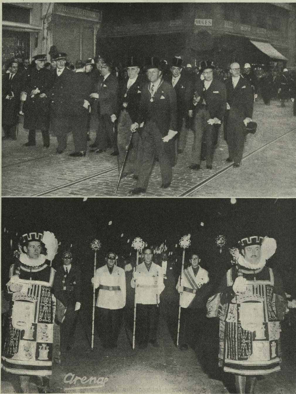
Arriba: La Corporación Municipal y la Diputación Provincial durante la visita a los Sagrarios en el Jueves Santo. Abajo: La representación municipal que asistió en Málaga a la Procesión de Nuestro Padre Jesús de la Puente del Cedrón y María Santísima de la Paloma

Día 24.—En el teatro Fuencarral se celebró el primero de los actos organizados