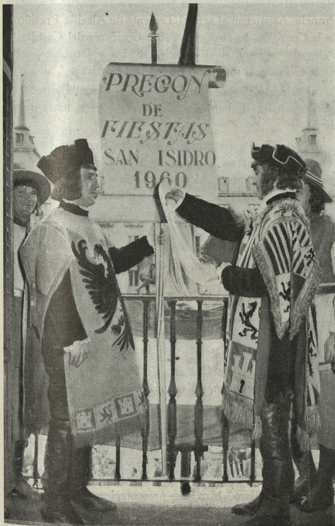
Lectura del pregón de las fiestas de San Isidro desde la Casa de la Panadería

El Alcalde rindió un homenaje al pueblo de Madrid y