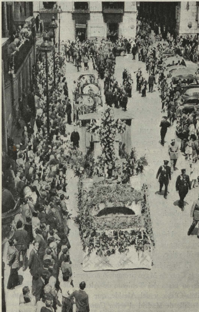
La Cabalgata de las Cruces de Mayo, en la plaza de la Villa