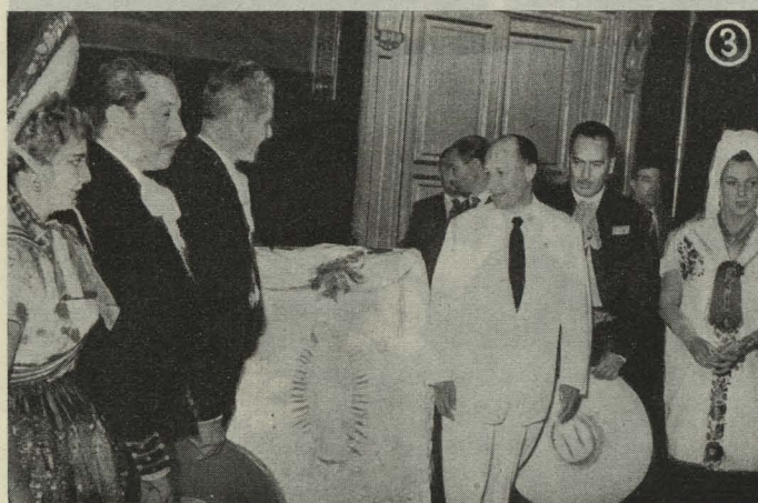
1. Mesa presidencial del agasajo ofrecido por el Ayuntamiento a los asistentes del IV Congreso Internacional de Riegos y Drenajes.—2. En el Colegio de San Ildefonso se celebró la Primera Comunión de los niños alumnos del Internado.—3. La Agrupación "Charros Mejicanos" entrega al Alcalde una imagen de la Virgen de Guadalupe