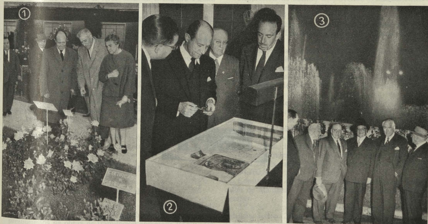
1. El Alcalde y su esposa, la Duquesa de Pastrana, inauguran el V Concurso Internacional de Rosas Nuevas.—2. El Alcalde con el Concejal Delegado de Museos, durante la inauguración de la Exposición "El Madrid de Carlos III".—3. Autoridades municipales inauguran la nueva fuente luminosa en la plaza de San Juan de la Cruz