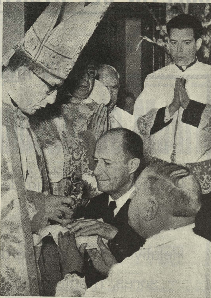
El Alcalde de Madrid hace entrega de la reliquia de San Ildefonso al Obispo auxiliar de la Diócesis