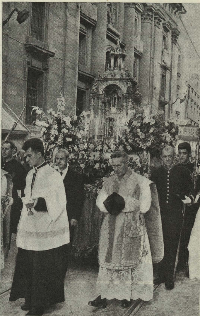
La custodia portadora del Santísimo Sacramento sale de la Catedral el día del Corpus Christi

Día 17. —En la Casa de la Villa se celebró una recep-