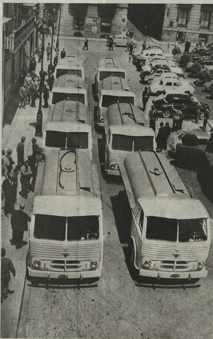
Camiones-aljibe adquiridos para los barrios de la periferia

—En la iglesia de San Francisco el Grande tuvo lugar el acto de recibir por vez primera la sagrada Comunión los