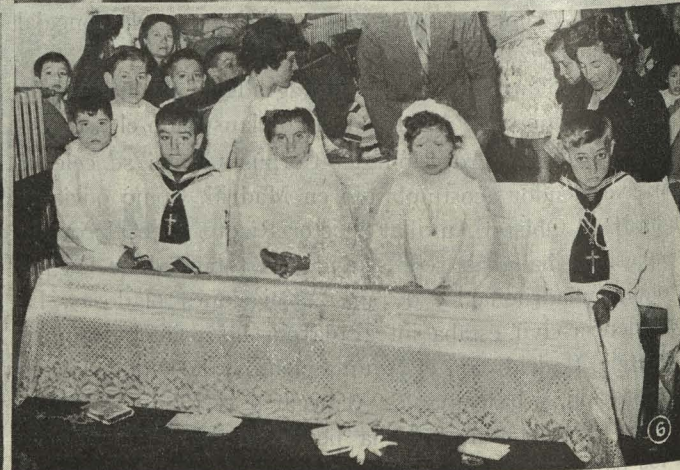
1. Un momento de la recepción ofrecida en honor del Congreso y Campeonato Internacional de Salvamento y Socorrismo.—2. El Presidente de la Casa de la Mancha entrega al Alcalde de Madrid el diploma de Consejero de honor de dicho Centro.—3. Una escena de la zarzuela Pan y toros representada en los jardines del Retiro.—4. Obreros portugueses, pertenecientes a la Fundación Nacional de la Alegría en el Trabajo, complimentan al Alcalde de Madrid.—5. El Conde de Mayalde inaugura el Equipo Quirúrgico número 2.—6. Los niños del Instituto Municipal de Educación celebran la Primera Comunión