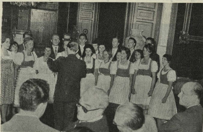
La Coral Madrigal de Viena da un concierto en el Ayuntamiento, interpretando varias canciones populares vienesas

tropolitano y la Exposición Henriquina, instalada en la Torre de Belem.