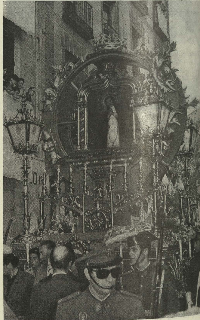
La carroza de la Virgen de la Paloma sale de la iglesia de San Pedro