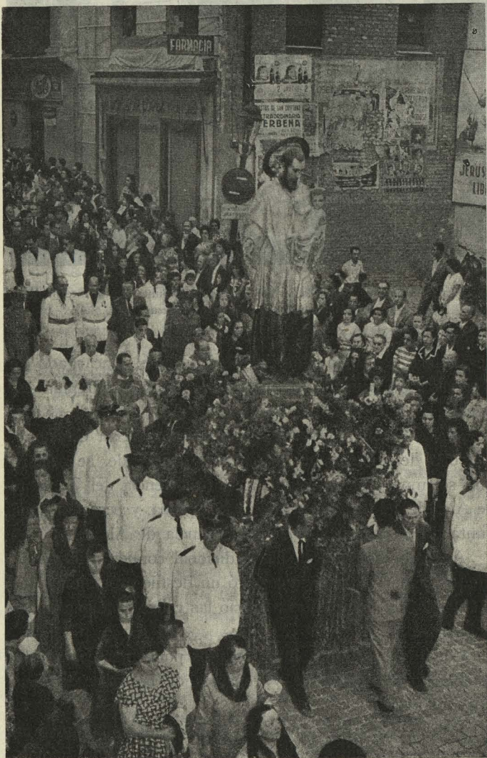
La Procesión de San Cayetano en su recorrido por las calles de la barriada

Día 15. —Con motivo de la festividad de Nuestra Señora