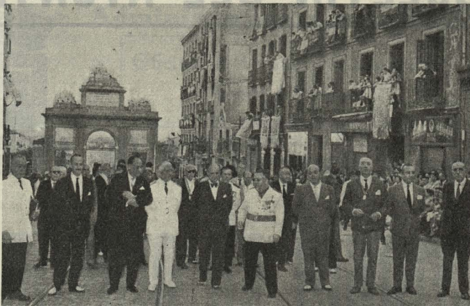
Presidencia civil de la Procesión de la Virgen de la Paloma

— En el templo Basilica de Atocha, también se celebró la tradicional y solemne misa en honor de la Virgen, y la sagrada imagen fué sacada procesionalmente por las calles