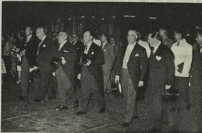
Presidencia de la Procesión de Nuestra Señora de la Almudena, Patrona de Madrid