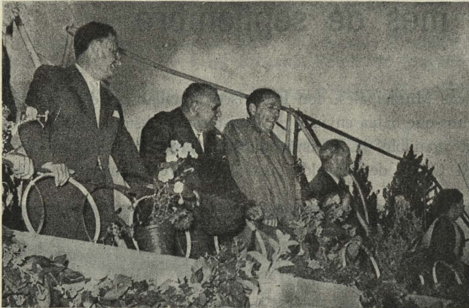
Presidencia de la clausura del Cursillo Escolar Municipal de Educación Física