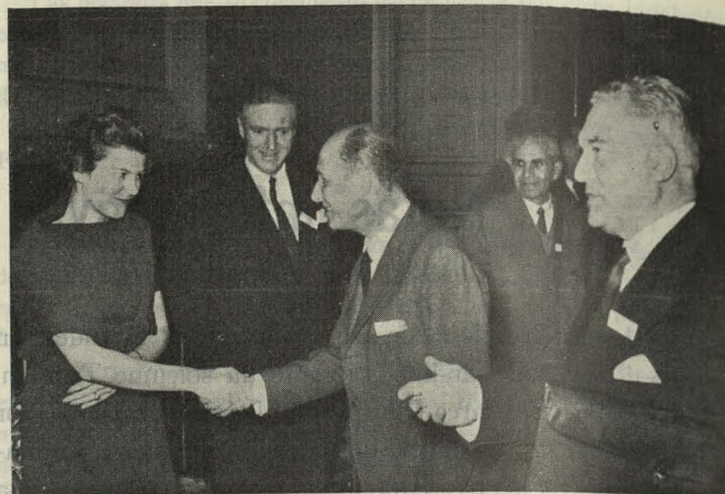
Recepción celebrada en honor de la VII Reunión Internacional de Ingenieros Sanitarios

día anterior a Madrid para ofrendarlas en Zaragoza a la Virgen del Pilar, Reina de la Hispanidad.