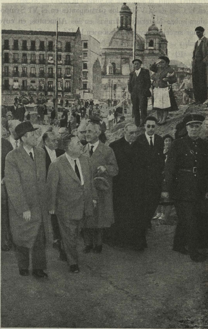
El Alcalde visita las obras de la gran vía San Francisco-Puerta de Toledo

— En honor de los participantes en la VII Reunión Internacional de Ingenieros Sanitarios, afecta a la Organización Mundial de la Salud, se celebró una recepción en la Casa de la Villa. El Alcalde dió la bienvenida a sus invitados, entre los que figuraba el Ministro de Sanidad de Bélgica, que fué presentado al Conde de Mayalde por el Presidente de la Reunión, Profesor don José Paz Maroto.