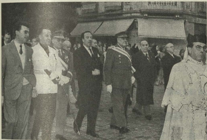
Presidencia civil de la Procesión de Nuestra Señora del Pilar

Le contestó el señor Arzobispo agradeciendo el bello simbolismo de aquellas flores.