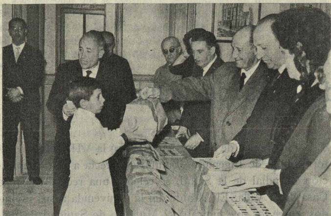
Después de la apertura del curso 1960-61, el Alcalde distribuye libros a los escolares

en la Casa de la Villa a los participantes en el VI Symposium sobre Materias Extrañas en los Alimentos, en cuyo honor se celebró una recepción en la Primera Casa Consistorial.