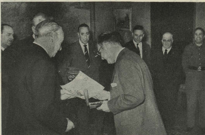
El Alcalde recibe la placa de Honor y de Mérito del Tiro Nacional

Con motivo de la fiesta titular del distrito, la Junta de Beneficencia que preside el señor Primo de Rivera había organizado diversos festejos y conciertos y distribuido una importante cantidad en metálico y ropas entre los necesitados.