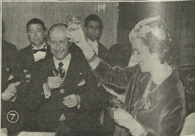
Homenaje del Ayuntamiento a doña Fabiola de Mora y Aragón: 1. Inaugura el Instituto de Urgencias Respiratorias que lleva su nombre.—2. En la Catedral de San Isidro se despiden de la Virgen de la Almudena.—3. Firma en el Libro de Oro.—4. Llegada a la Casa de la Villa.—5. El Alcalde hace entrega de los obsequios de la Corporación Municipal.—6. Saluda al pueblo de Madrid desde el balcón del Ayuntamiento.—7. Brinda su copa con el Alcalde de Madrid.