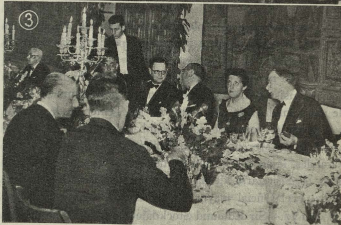
1. Llegada a Madrid de Sir Edmund Stockdale, ex Lord Mayor de Londres. 2. El Alcalde de Madrid impone la Medalla de Oro de la ciudad a Sir Edmund Stockdale.—3. Comida ofrecida en el Ayuntamiento al ex Lord Mayor de Londres Sir Edmund Stockdale.

Día 16. —A primera hora de la tarde, Sir Edmund Stockdale, ex Lord Mayor de Londres, llegó a la Casa de la Villa.