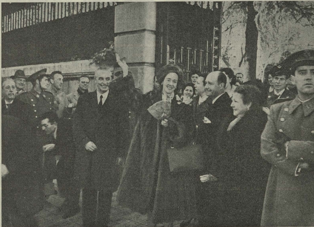
Doña Fabiola de Mora, acompañada del Alcalde de Madrid, se despide del pueblo madrileño

Muchísimas gracias por haberme proporcionado esa gran alegría organizando con tanta perfección mi contacto con