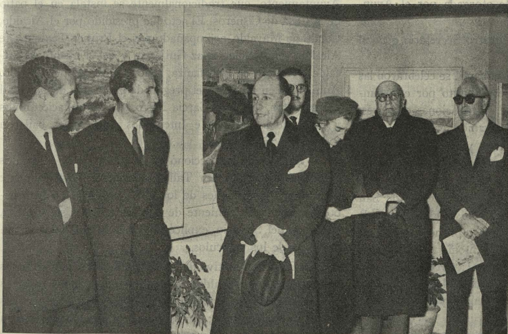
Un momento de la inauguración, por el Alcalde de Madrid, de la Exposición de Paisajes, homenaje a Velázquez

Día 22. — Los jugadores del Real Madrid recibieron de manos del Alcalde, en uno de los salones de la Casa de la