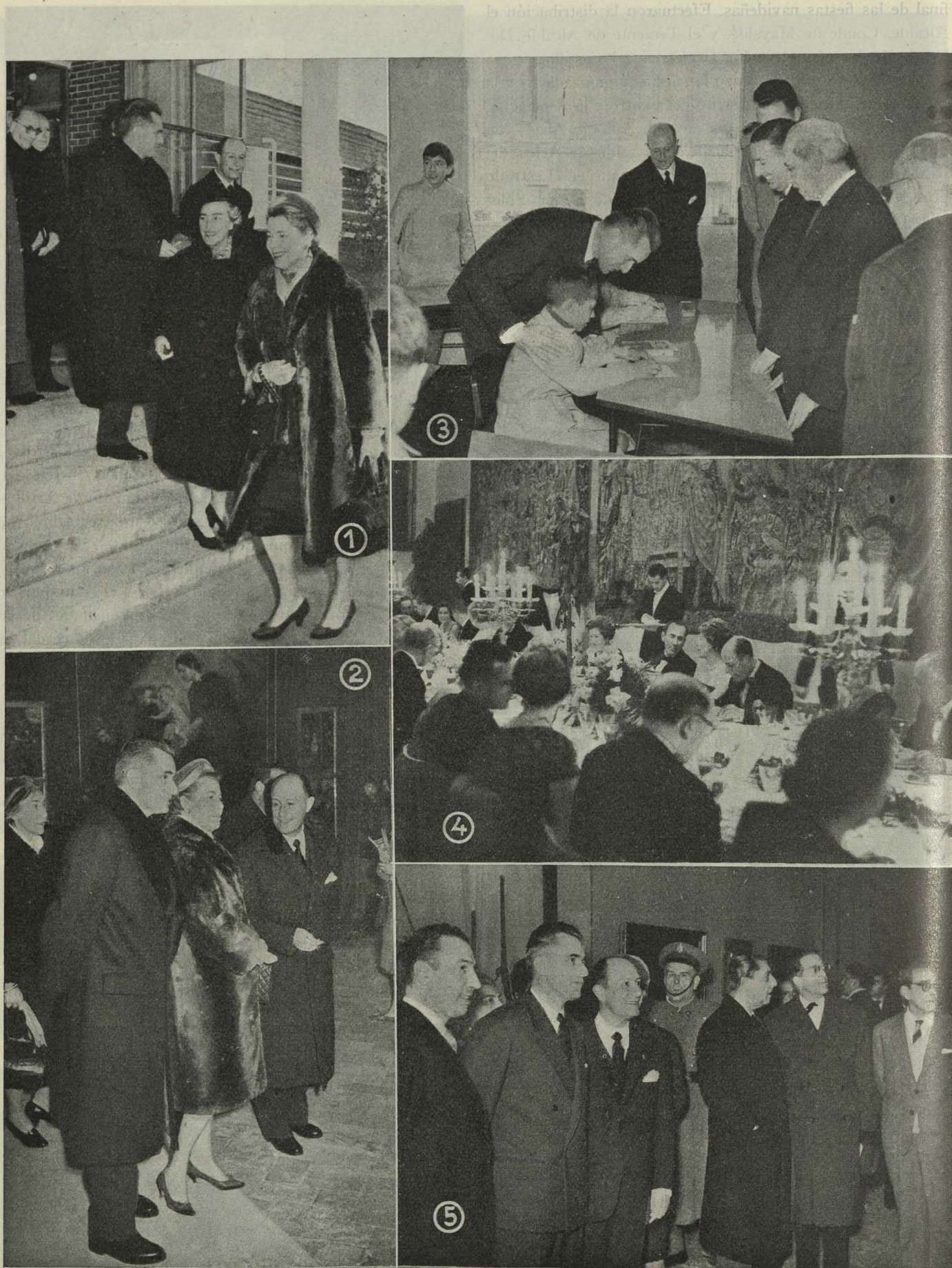
Estancia del Presidente de la Asamblea Francesa y Mme. Chabán Delmás en Madrid: 1. Llegada al aeropuerto de Barajas.—2. Visita al Museo del Prado. 3. En el Instituto Municipal de Educación.—4. Comida en el Ayuntamiento.—5. En la Exposición de Velázquez y lo Velazqueño.