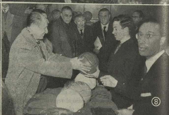
La fiesta de los Reyes Magos: 1. La Cabalgata de los Reyes Magos desfilando por las calles madrileñas.—2. Recepción de los Reyes Magos en la Casa de la Villa.—3. En el Servicio del Matadero y Mercado de Ganados.—4. En la Tenencia de Alcaldía de Arganzuela-Villaverde.—5. En el colegio Internado Palacio Valdés.—6. En el de San Ildefonso.—7. Reparto de juguetes a las niñas de las escuelas.—8. En el de Nuestra Señora de la Paloma