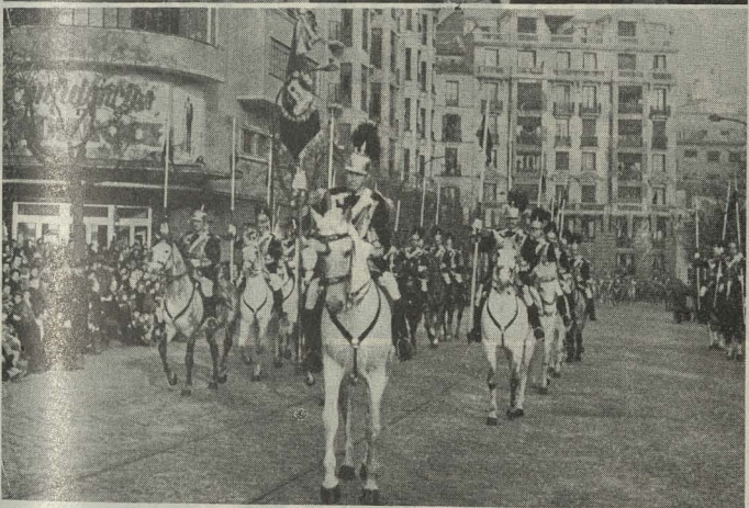
Fotografía superior: El Jurado calificador del concurso celebrado con motivo de las fiestas de San Antonio Abad.—Fotografía inferior: Un detalle del desfile de las fiestas de San Antonio Abad