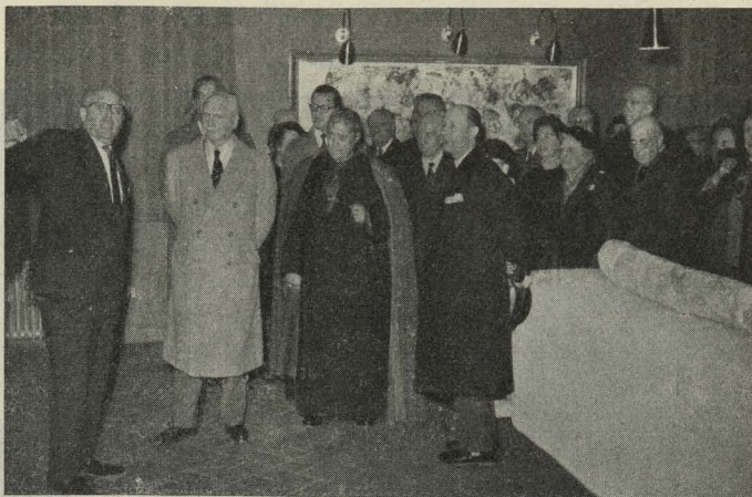
Inauguración del Museo Arqueológico Municipal

Por la tarde se organizó el tradicional desfile por las calles de Barceló, Mejía Lequerica y Fuencarral. En una tribuna levantada al efecto figuraba el Jurado que había de discernir los premios, compuesto por el señor Soler Díaz-Guijarro, el Gobernador militar de Madrid, general Uhagón; Presidente de la Diputación Provincial, Marqués de