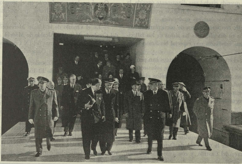
El Jefe del Estado, Generalísimo Franco, inaugura el Ferrocarril Suburbano entre la plaza de España y Carabanchel

Día 20. —En el patio de Cristales del Ayuntamiento se inauguró la Exposición de carteles anunciadores de las próximas fiestas de San Isidro, Patrono de Madrid.