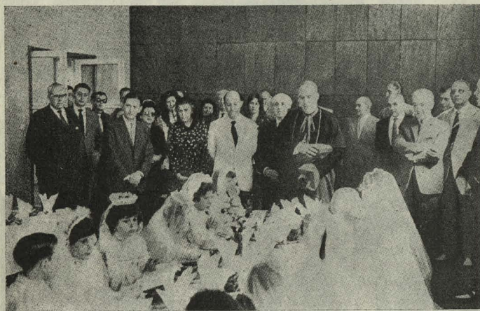
Los niños de las clases del Instituto Municipal de Educación después de su primera Comunión