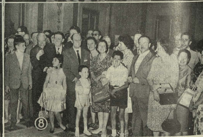
1. Las autoridades locales en la presidencia de la Procesión del Santísimo Corpus Christi.—2. La excelentísima señora doña Carmen Polo de Franco sale del funeral celebrado en la Parroquia de San Francisco, del Puente de Vallecas.—3. El Alcalde hace entrega de la suscripción abierta en favor de los familiares de las víctimas de la calle de Uceda.—4. Los participantes en el "rallye" Bruselas-Paris-Madrid visitan al Alcalde, Conde de Mayalde.—5. El Alcalde de Madrid saluda al segundo Alcalde de Bonn, señor Kraemer.—6. Un momento de la recepción celebrada en honor de los Colegios Oficiales Industriales.—7. Los artistas del Teatro de Ensayo de la Universidad Católica de Chile con el Conde de Mayalde.—8. Los trabajadores portugueses, durante su visita a la Casa de la Villa, rodean al Alcalde de Madrid