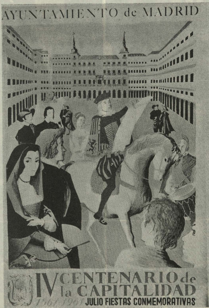
Cartel anunciador de las fiestas del cuatricentenario de la capitalidad