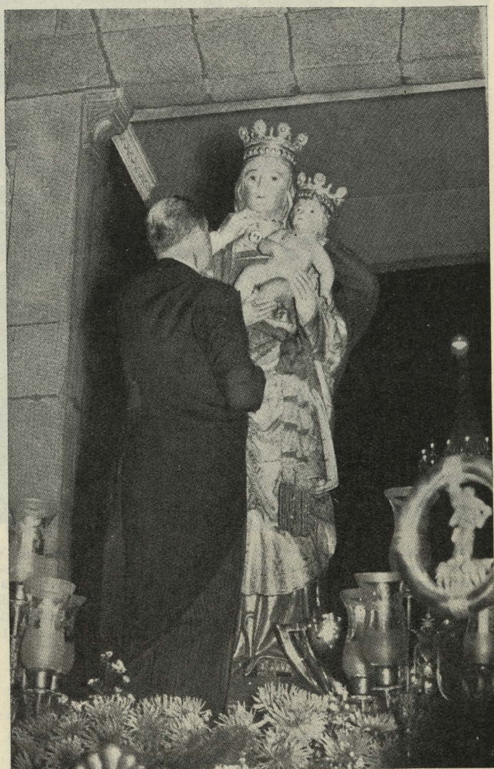
El Alcalde impone la Medalla de Honor de Madrid a la imagen de la Virgen de la Almudena

Día 12. —Se clausuró, en la Piscina Municipal de la Casa de Campo, el IX Kursillo Escolar Municipal de Nata-