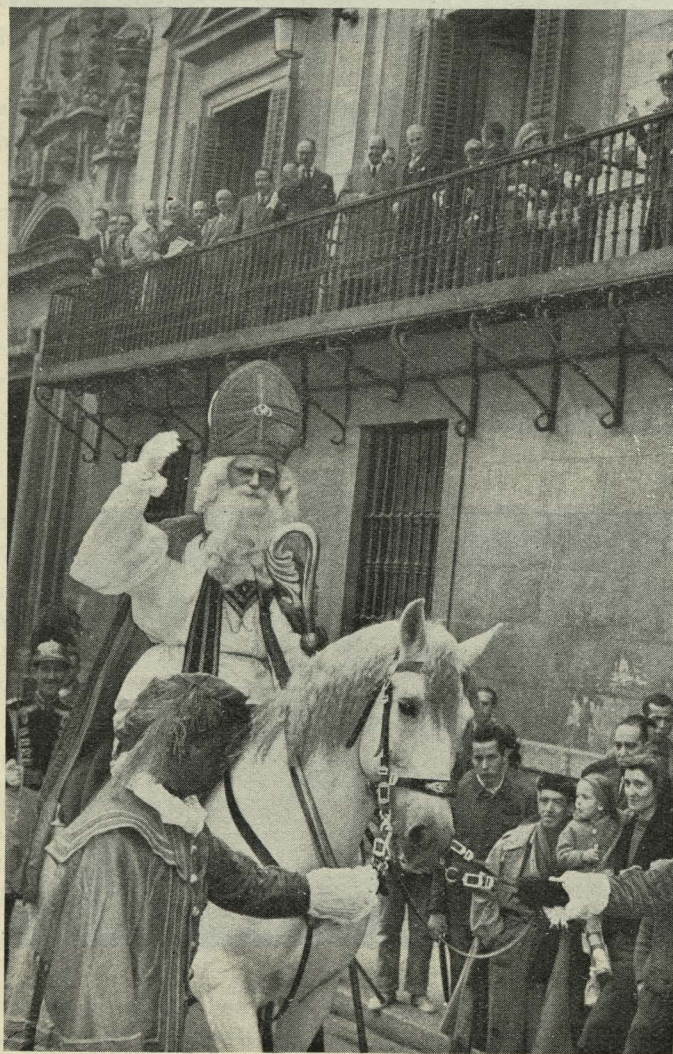
La simbólica figura de San Nicolás es despedida, al salir para Holanda, por el Alcalde de Madrid

Los semanistas fueron obsequiados con una copa de vino español.