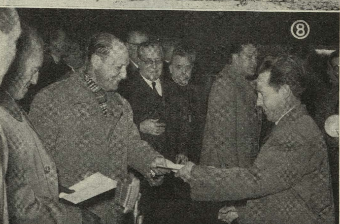
1. Un momento de la bendición e inauguración de la Guardería infantil Duquesa de Pastrana.—2. El Teniente de Alcalde de Arganzuela-Villaverde distribuye lotes benéficos entre los necesitados de la barriada.—3. Comida en honor del grupo belga-español de la Unión Interparlamentaria.—4. Mesa presidida por la Duquesa de Pastrana durante la cuestación de la Fiesta de la Banderita.—5. Una representación de técnicos visita al Conde de Mayalde con ocasión del Día Mundial de Urbanismo.—6. Bendición del nuevo cementerio de El Pardo, con asistencia del Alcalde de Madrid.—7. Los semanistas de Accidentes del Trabajo visitan al Alcalde, Conde de Mayalde, en la Casa de la Villa.—8. El Alcalde hace entrega de ciento veinticinco viviendas a los mutualistas de la Colonia de San José Obrero, de Carabanchel.