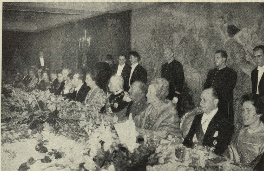
Banquete ofrecido por el Ayuntamiento al Presidente de la República de Portugal, con asistencia del Generalísimo Franco y su esposa

El Conde de Mayalde habló sobre las diversas etapas re-