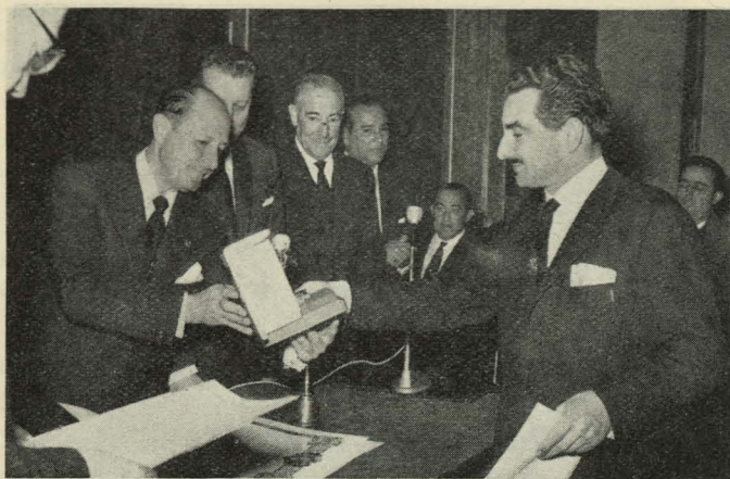
Entrega de premios del concurso de escaparates e instalaciones comerciales, con motivo de las fiestas de la Capitalidad