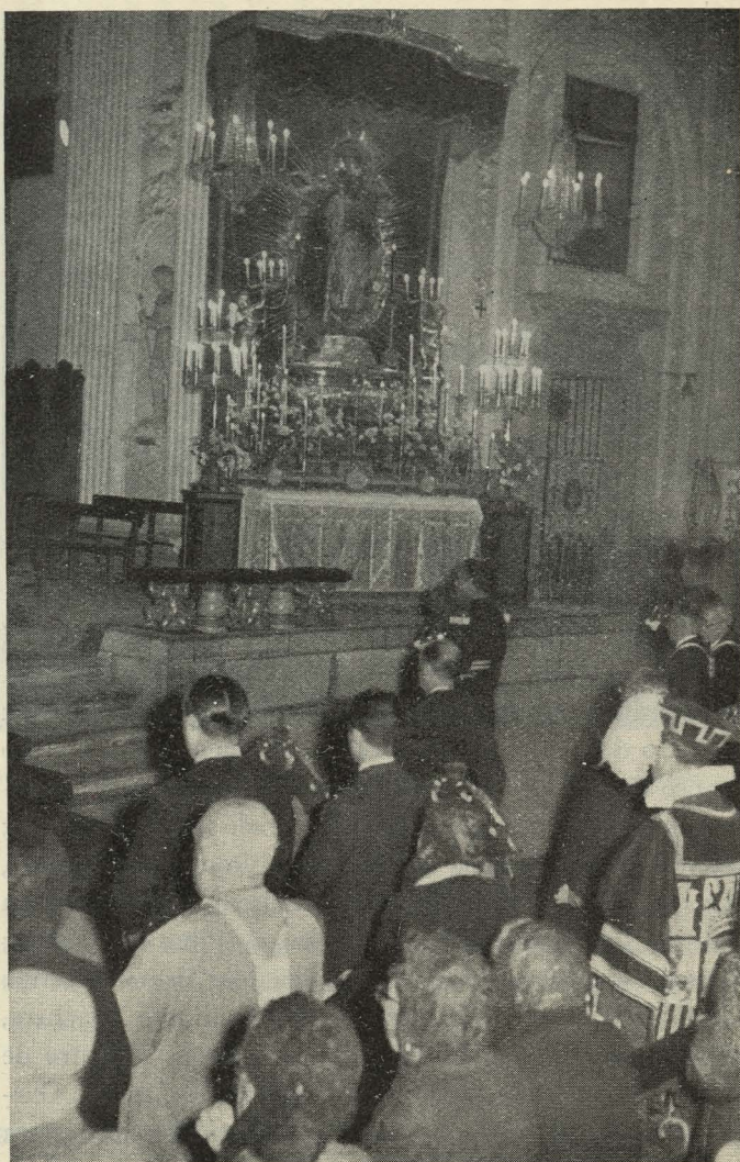
Con asistencia del Ayuntamiento en Corporación se celebra la fiesta de Nuestra Señora de la Almudena