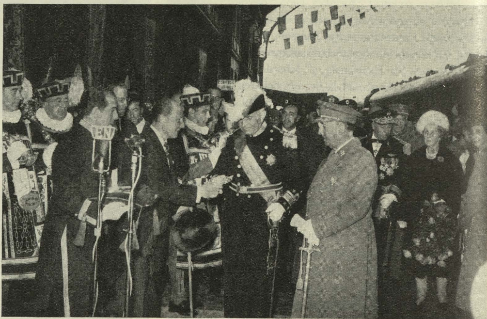
A la llegada del Presidente de la República portuguesa, Contraalmirante Américo Thomas, el Alcalde de Madrid le hace entrega de la Llave de la Ciudad, en presencia del Jefe del Estado español, Generalísimo Franco

Día 27. —En el Instituto Municipal de Educación, el Ayuntamiento madrileño ofreció una brillante recepción a los educadores de las escuelas de Madrid.