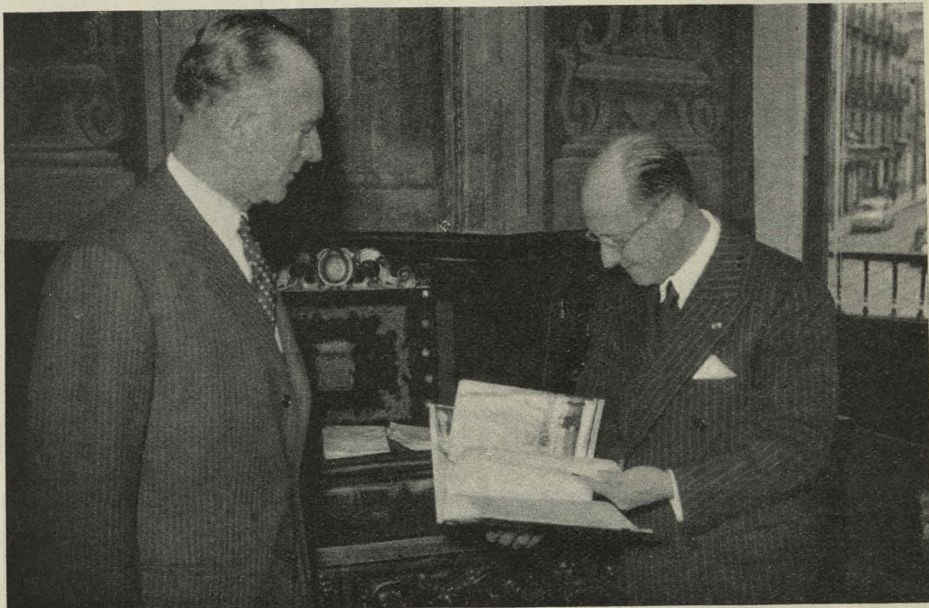
Entrevista del Comisario general del Turismo francés con el Alcalde de Madrid

Fueron recibidos por el Concejal Delegado de Archivos