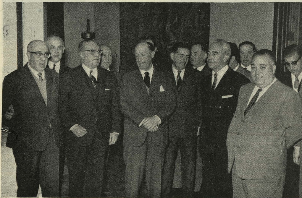
Recepción ofrecida por el Alcalde a los Jefes y funcionarios en la fiesta de fin de año

— En la Casa de la Villa se celebró una recepción en honor de un centenar de profesores costarricenses, que entregaron al Alcalde un pergamino de la Municipalidad de San Juan de Costa Rica.