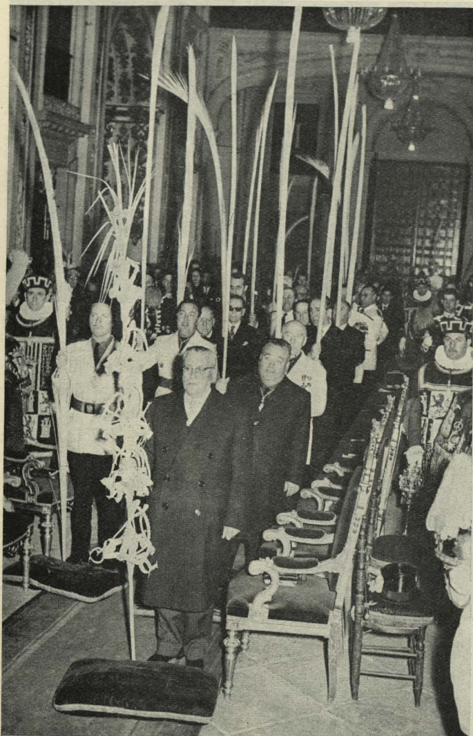
El Ayuntamiento, en corporación, durante la Misa de las Palmas celebrada en la Catedral de San Isidro el Domingo de Ramos