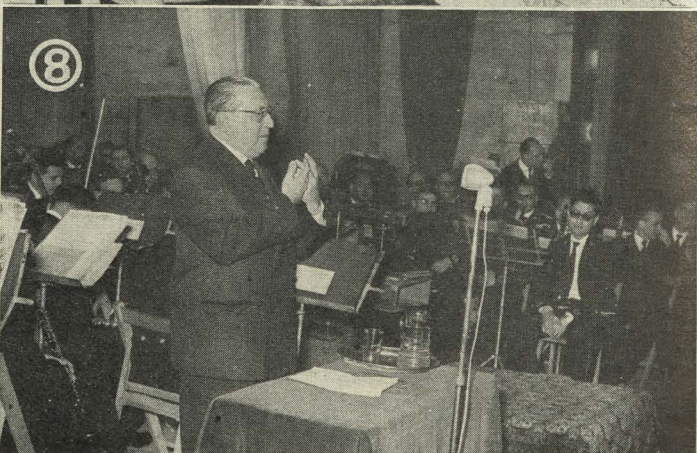
1. La Corporación Municipal presidiendo la Procesión del Santo Entierro.—2. El Alcalde, Conde de Mayalde, durante la solemne sesión celebrada en el Ayuntamiento con motivo de la inauguración del monumento a don Jacinto Benavente.—3. El Lord Mayor de Manchester firma en el Libro de Oro de la Villa.—4. El Alcalde de Madrid y el Lord Mayor de Manchester se dirigen al salón de Tapices para asistir a la cena con que el Ayuntamiento obsequió al Alcalde de esta ciudad inglesa.—5. El Alcalde y demás autoridades durante la inauguración del nuevo Mercado de la Cebada.—6. La excelentísima señora doña Carmen Polo de Franco preside la fiesta de las Fibras Artificiales celebrada en el Retiro.—7. El Conde de Mayalde impone la Medalla de oro de la Villa a la Duquesa de Alba.—8. El Primer Teniente de Alcalde, señor Soler Díaz-Guijarro, lee el Pregón de las fiestas del Dos de Mayo, en acto celebrado en el teatro Fuencarral.