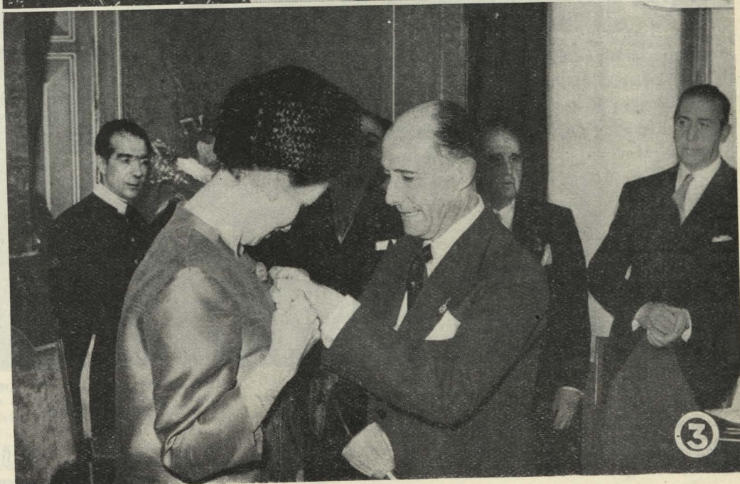
1. La Marquesa de Villaverde firma en el Libro de Oro de la Villa.—2. El Alcalde durante el discurso pronunciado con motivo de la entrega a la Marquesa de Villaverde del título de Hija Adoptiva de Madrid.—3. El Alcalde impone a la Marquesa de Villaverde la medalla correspondiente al título de Hija Adoptiva de Madrid.