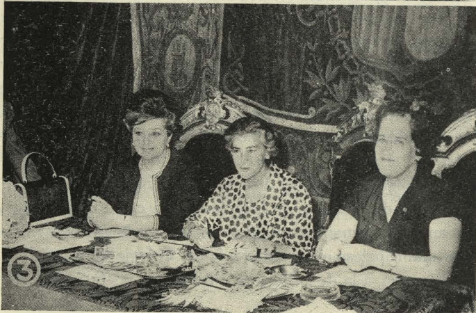
1. El Conde de Mayalde impone la medalla de oro de Madrid a S. E. el Cardenal Antoniutti.—2. El Ayuntamiento y la Diputación Provincial durante la solemne misa celebrada en la Catedral con motivo de la festividad de San Isidro.—3. La Duquesa de Pastrana preside la mesa instalada en la plaza de la Villa con motivo del Día del Cáncer.

de oro de Madrid a su Eminencia el Cardenal don Hildebrando Antoniutti.