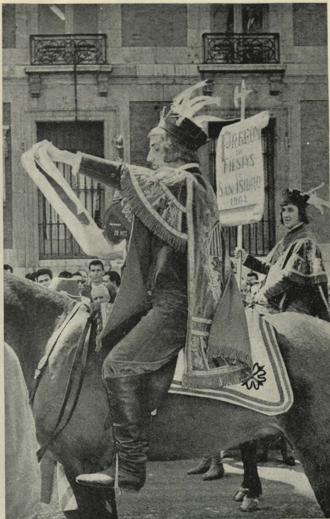
En la Puerta del Sol, un heraldo lee el pregón de las fiestas de San Isidro