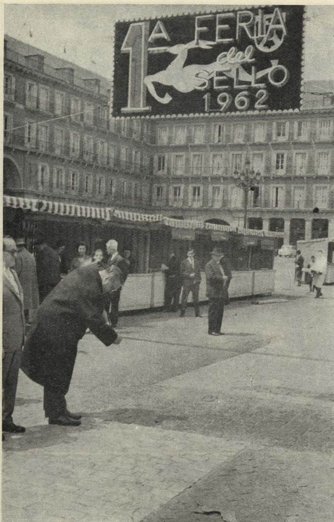
El Primer Teniente de Alcalde inaugura la Primera Feria Nacional del Sello

tes a la VII Reunión de la Tabla Redonda y del Comité Permanente del Consejo Internacional de Archivos.