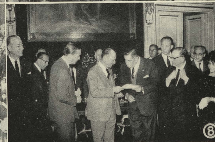
1. El Conde de Mayalde recibe la Medalla de oro conmemorativa del IV centenario de la fundación de la Ciudad de Mendoza.—2. Acto de la bendición del nuevo gimnasio instalado en La Chopera, del Retiro.—3. Actuación de grupos regionales durante el homenaje rendido al Ayuntamiento de Madrid.—4. El Alcalde y la Duquesa de Pastrana en la Exposición de Rosas Nuevas del Parque del Oeste.—5. El Alcalde de Madrid en la Exposición de Santos Patronos de Madrid, inaugurada en el Museo Municipal.—6. El Conde de Mayalde hace entrega de los premios concedidos con motivo del VII Concurso Internacional de Rosas Nuevas.—7. El patio del Matadero durante el acto de la primera Comunión de los hijos de los empleados del establecimiento.—8. El Alcalde hace entrega simbólica de la estatua de Cervantes al Encargado de Negocios de Bolivia.