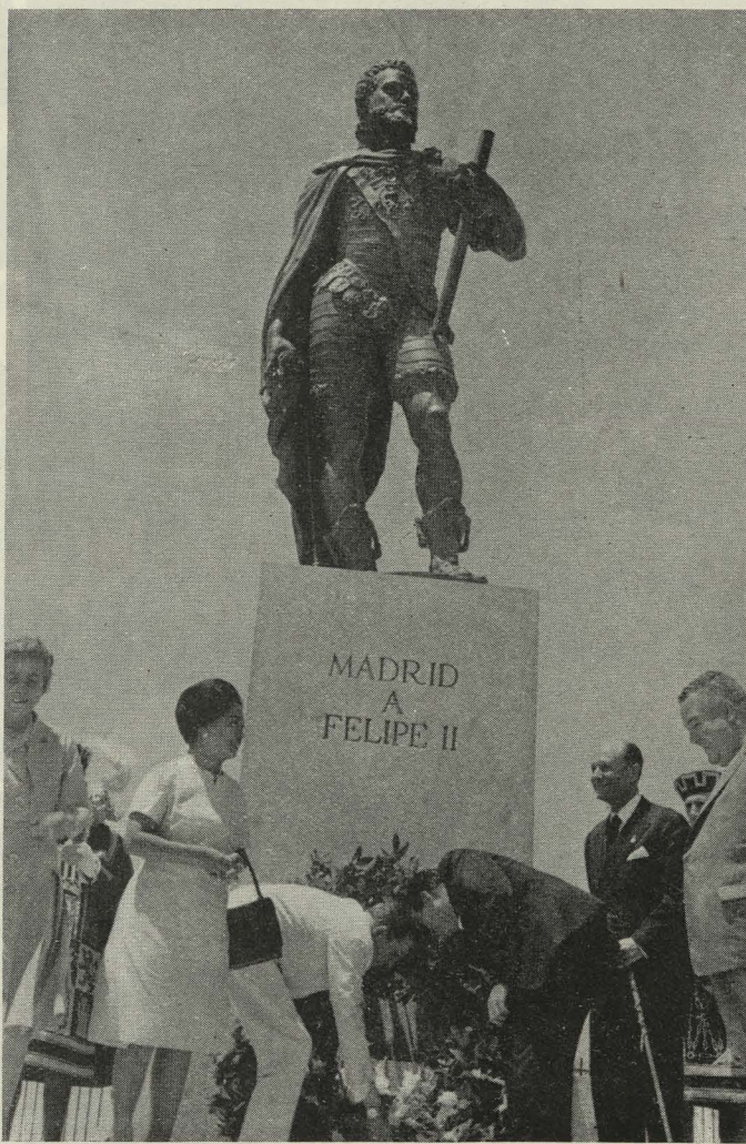
El Presidente de Filipinas, don Diosdado Macapagal, depositando una corona de laurel al pie de la estatua de Felipe II.

El director general de Urbis hizo entrega al Presidente Macapagal de la Llave de Oro de la nueva ciudad que es Moratalaz, réplica exacta de la que durante su visita a este