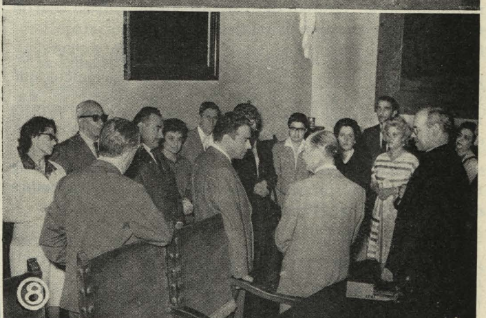
1. El Alcalde firma la escritura de cesión de terrenos para la construcción del templo y Colegio Mayor de Nuestra Señora de Guadalupe.—2. La Corporación Municipal, en la presidencia de la Procesión de Nuestra Señora de la Almudena.—3. Los niños de las escuelas municipales, en la clausura del X Cursillo Escolar de Educación Física.—4. El Alcalde y otras personalidades en el acto de la clausura del X Cursillo Escolar de Natación.—5. El Ayuntamiento en el homenaje a Santa Teresa en su templo nacional.—6. Entrega de pingüinos para la Casa de Fieras, del Retiro.—7. El Alcalde recibe las llaves de la ciudad de Miami.—8. Los embajadores de la Amistad, de Méjico, cumplimentan al Alcalde.