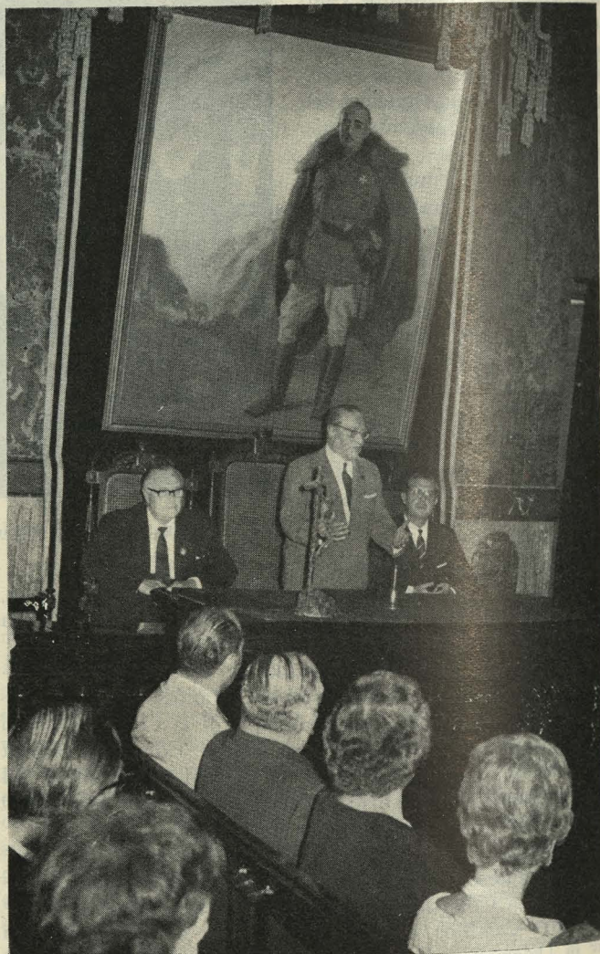
Un momento de la recepción celebrada en honor de los asambleístas de la Interpol