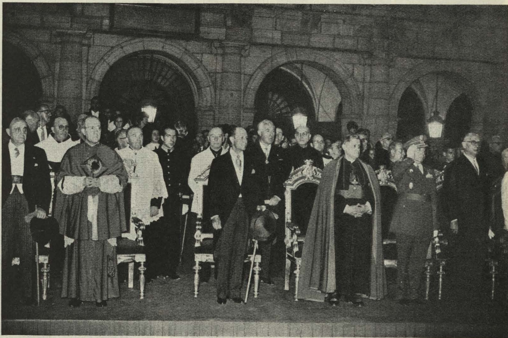
Autoridades municipales, militares y eclesiásticas durante el acto de recepción de la reliquia de Santa Teresa

— Por la tarde, en los jardines de Cecilio Rodríguez,