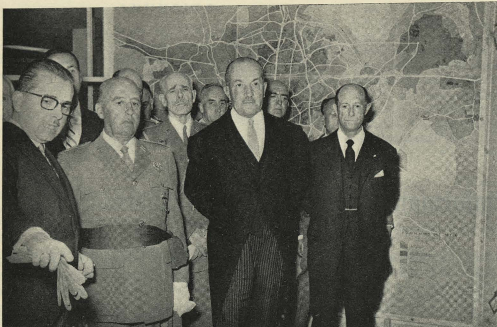
Su Excelencia el Jefe del Estado durante la inauguración de la Exposición del plan general de ordenación urbana de Madrid

Industria, señor López Bravo; de Comercio, señor Ullastres, y de la Vivienda, señor Martínez Sánchez-Arjona.