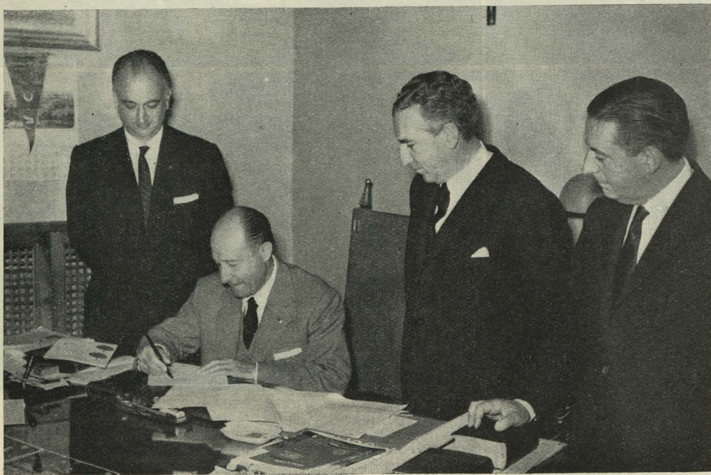
El Alcalde firmando el acuerdo para la construcción de escuelas