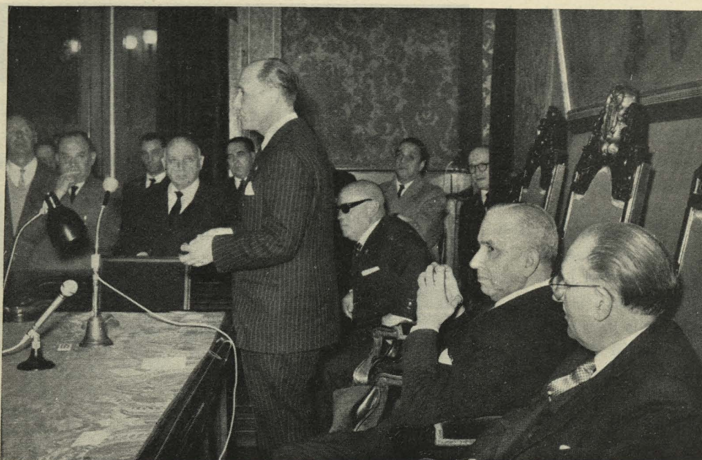
El Alcalde pronuncia un discurso en el acto académico organizado para dar los premios de las Justas Poéticas del Centenario de Lope de Vega

Isidro, General Mola, Isabel la Católica, Calvo Sotelo, Menéndez Pelayo y Joaquín García Morato.