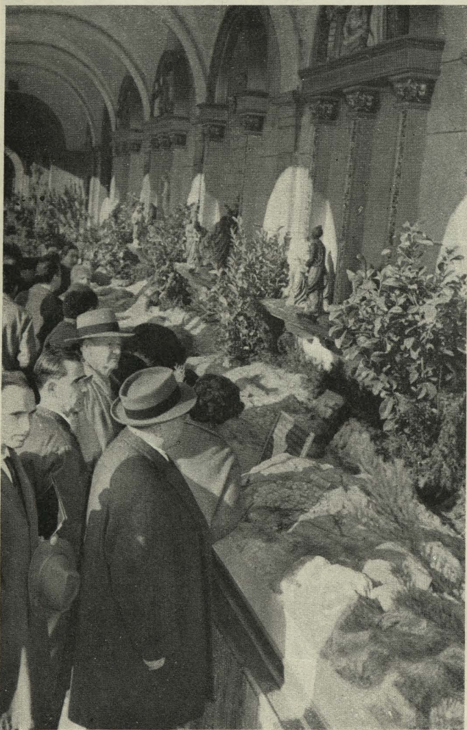
El Teniente de Alcalde del distrito del Centro contempla el Belén instalado en los soportales de la Casa de la Panadería

— El Conde de Mayalde, al que acompañaba el Alcalde de Burdeos, señor Chabán-Delmás, inauguró la nueva iluminación de la plaza del Callao, cuya característica principal es conseguir luz de espectro solar. El nuevo sistema cuenta con tres postes de veintidós metros y medio de al-