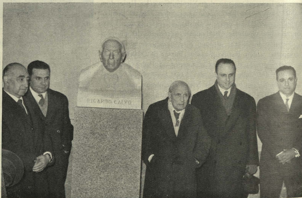
Inauguración del busto de don Ricardo Calvo, en el teatro Español

El Conde de Mayalde expresó su gratitud con frases emocionadas, y puso de manifiesto la común tarea de defensa de la civilización cristiana de España en Occidente y de Filipinas en Oriente, y expresó su satisfacción por haberle correspondido recibir al Presidente Macapagal en su inolvidable visita a España.