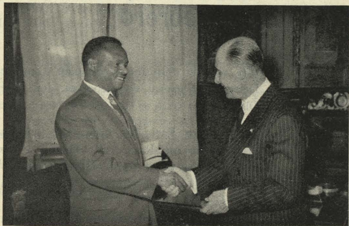
El Conde de Mayalde saluda, en su despacho de la Casa de la Villa, al Alcalde de Nairobi, señor Alderman Rubia

Día 21. —En la mañana de este día visitó el Ayuntamiento el Alcalde de Nairobi, capital de Kenya, señor Alderman Rubia, que había sido declarado huésped de honor