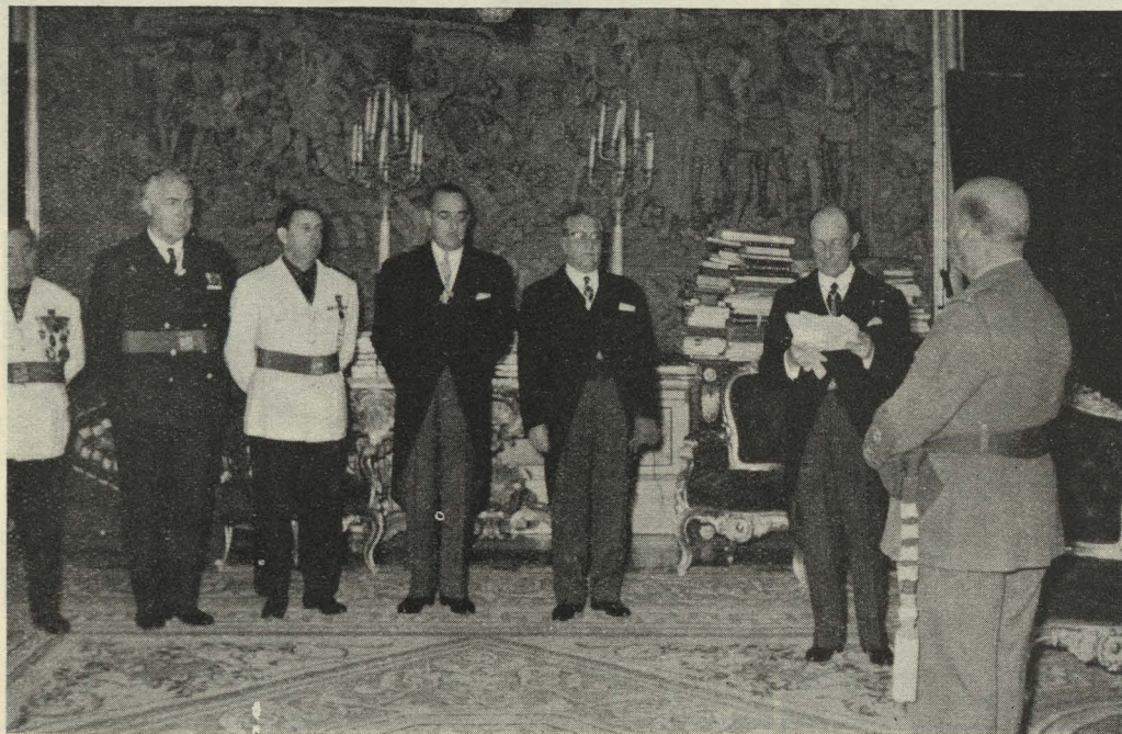
El Ayuntamiento de Madrid cumplimenta a Su Excelencia el Jefe del Estado con motivo del XXIV aniversario de la liberación de la capital

Preocupación esencial del Ayuntamiento que presidido es atender por igual a las necesidades impuestas por el incesante