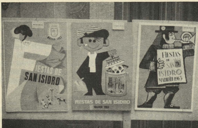
Carteles de las fiestas de San Isidro que obtuvieron los tres primeros premios

al finalizar sus conciertos. Exaltó el genio musical del pueblo catalán y terminó con un "Viva Barcelona".