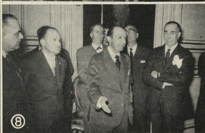
1. El Primer Teniente de Alcalde dirige la palabra a los equipos de Judo de Altos Estudios Comerciales de Francia y de la Escuela Samurái.—2. El Alcalde entrega los premios del XI Concurso de Instalaciones Comerciales.—3. Los representantes diplomáticos de los países islámicos, en el Museo Arqueológico de la Villa.—4. El Conde de Mayalde dirige la palabra a los componentes del Orfeo Catalá.—5. El Alcalde recibe el trofeo conmemorativo de los XI Juegos Universitarios.—6. El Conde de Mayalde con la Comisión de San Agustín de la Florida.—7. El Conde de Mayalde examina el aparato para diagnósticos de visión, obsequio del Sindicato de la Construcción.—8. El Alcalde durante la recepción ofrecida a los participantes en el V Curso Internacional del Derecho de la Circulación.