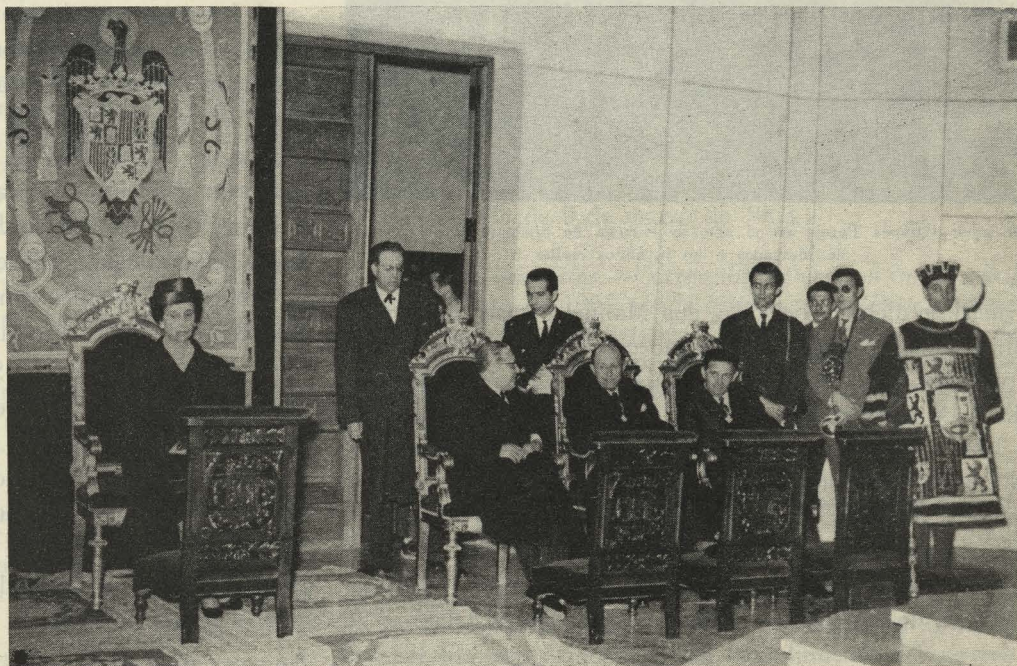
La excelentísima señora doña Carmen Polo de Franco y el Conde de Mayalde al frente de la representación municipal en el acto de bendición del templo del Santísimo Cristo de la Victoria

— Por la tarde fué inaugurado un nuevo templo parroquial bajo la advocación del Santísimo Cristo de la Victoria, situado en la calle de Blasco de Garay. Asistió a la cere-