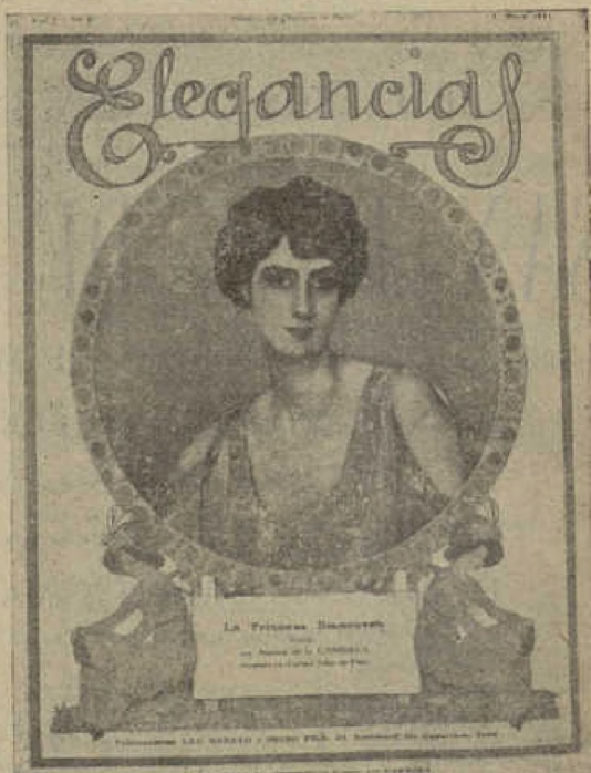
Reducción de la cubierta (tamaño 25 x 32)