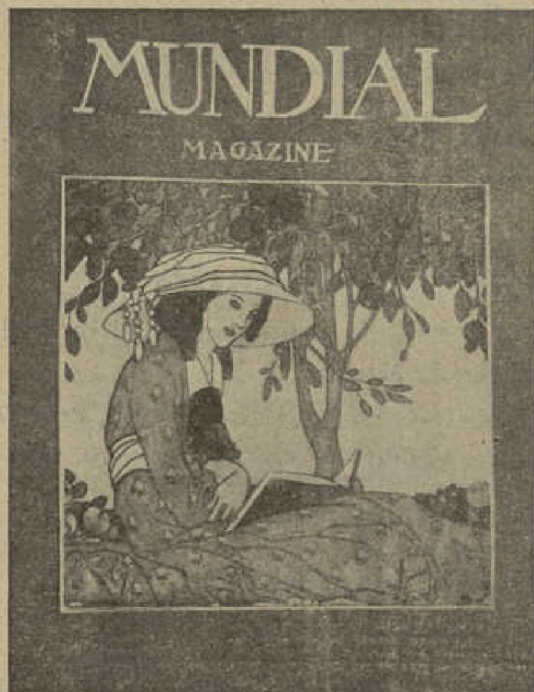
Reducción de la cubierta (tamaño 10 x 26)

PUBLICACIONES LEO MERO Y Sociedad de Ediciones LOUS-M Para España y las Librería GARNIER Rue