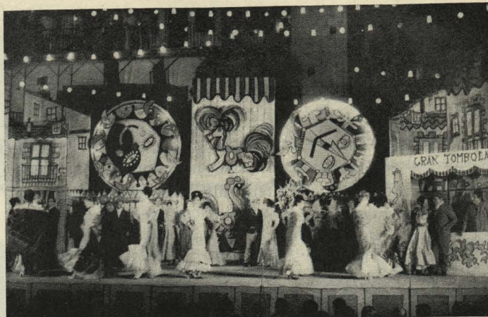
Representaciones populares de El pobre Valbuena en La Corrala

A las ocho de la tarde salió la Procesión con la imagen de la Virgen de la Paloma, instalada en su nueva carroza. Frente al edificio de la Tenencia de Alcaldía se hizo una ofrenda a la Virgen y se cantó la Salve. El cortejo estuvo