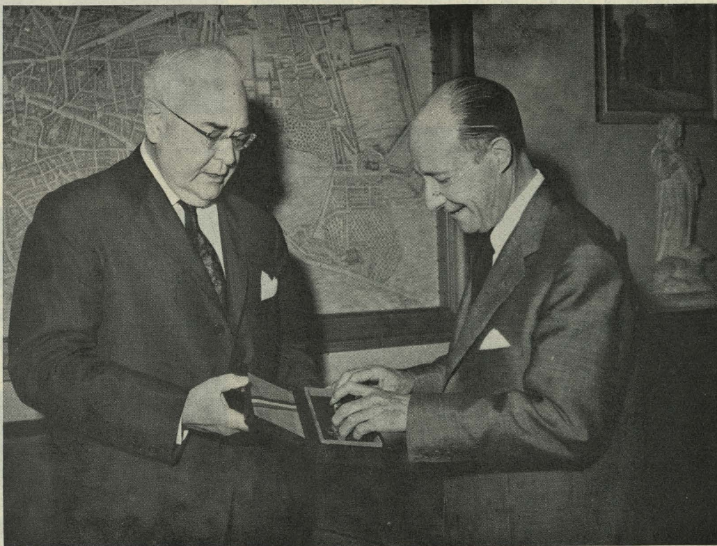
Entrega de la llave de la ciudad de los Angeles al Conde de Mayalde

A las doce y media, en el salón de Sesiones de la Casa Consistorial, le fué impuesta la corbata del Ayuntamiento de San Sebastián a la bandera del Ayuntamiento de Madrid. Al Alcalde de Madrid se le impuso la medalla de plata de las Conmemoraciones Centenarias, y a los demás ediles que asistían al acto la medalla de bronce.