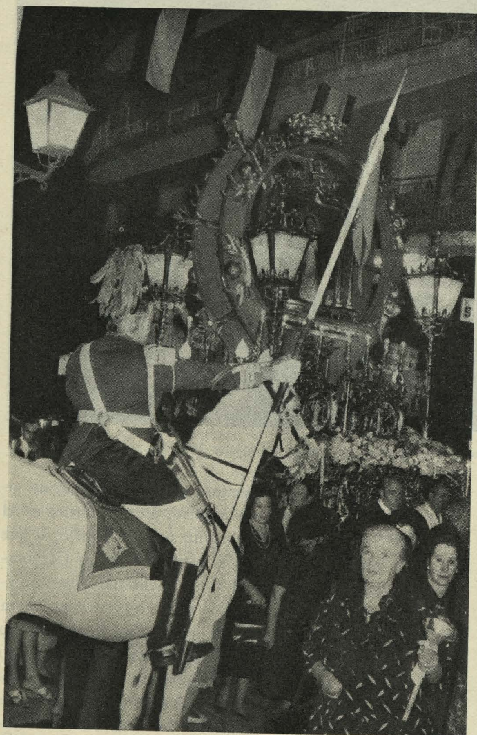
La Virgen de la Paloma recorre las calles del distrito de la Latina