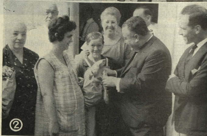
1. El Teniente de Alcalde de la Latina preside la Procesión de la Virgen de la Paloma.—2. Entrega de bolsas de comida a los necesitados del distrito de la Latina