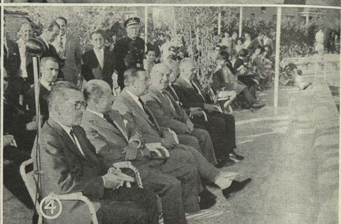
1. Clausura del XI Cursillo Escolar de Natación en la Piscina de la Casa de Campo.—2. El Alcalde dirige la palabra a las componentes del Garden, Club de Costa Rica.—3. Los niños de la Operación Plus Ultra con el Alcalde.—4. El Alcalde durante la inauguración de la piscina de Vallecas

Quiero en esta ocasión enviar a los barceloneses todos y a su excelentísimo Ayuntamiento y a su Alcalde, con quien me unen profundos vínculos de amistad, mi más cariñoso y efusivo saludo.