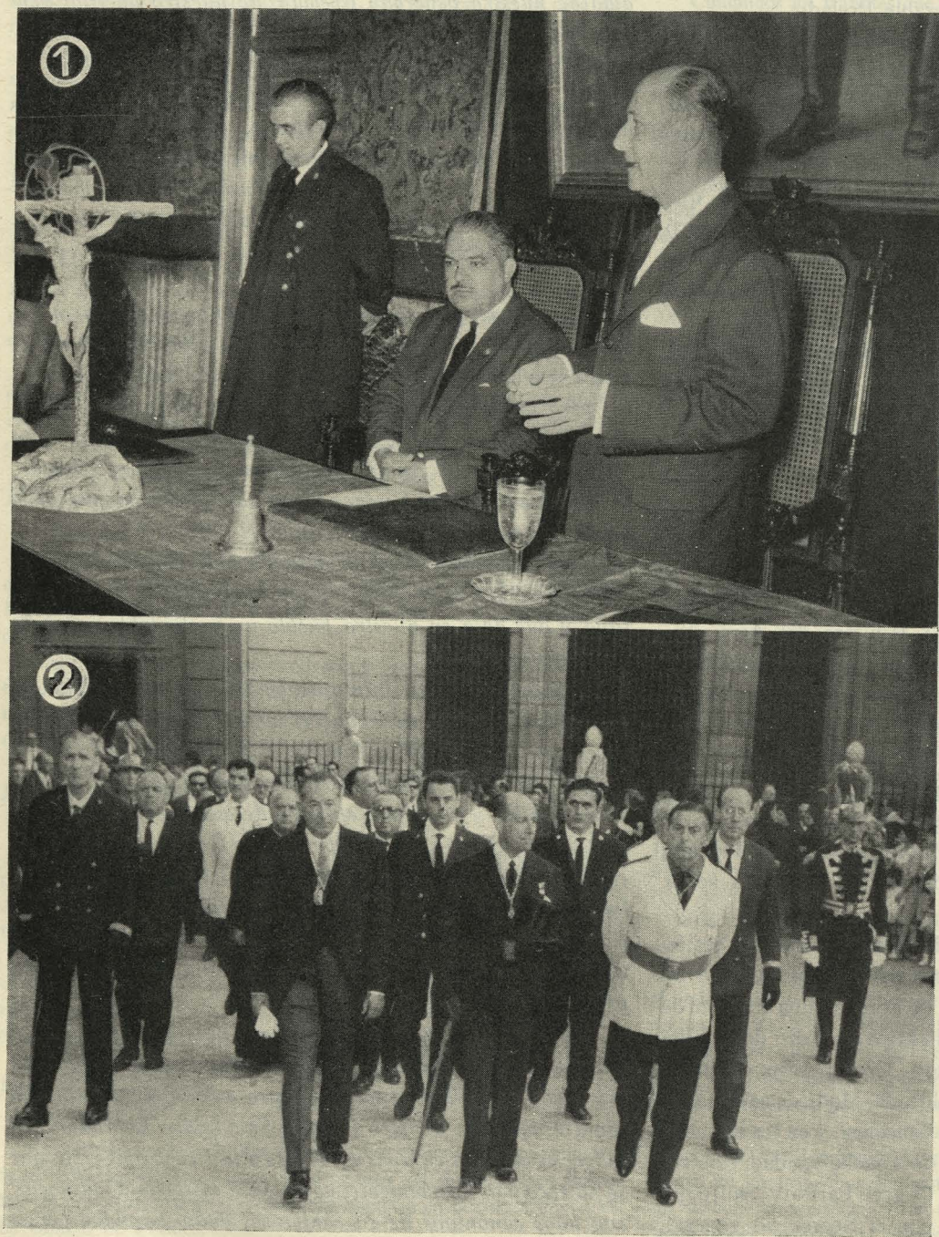
1. Presidencia del Pleno extraordinario en homenaje póstumo al Obispo Doctor Eijo y Garay.—2. El Ayuntamiento, en corporación, en el entierro del Doctor Eijo y Garay

Por otra parte, la Permanente, hace un momento, ha acordado que la más hermosa calle o plaza del barrio de Santa Marca o de la Colonia del Patriarca lleve para siempre el nombre de nuestro santo e inolvidable Prelado.