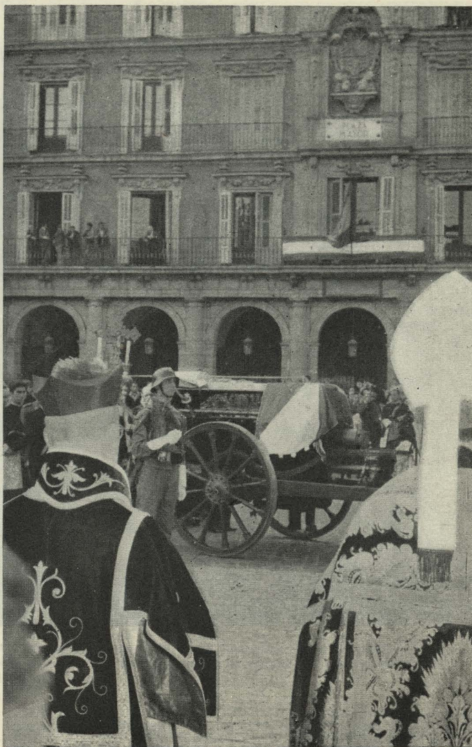
El cadáver del Patriarca Obispo pasa por la Plaza Mayor

— Al aeropuerto de Barajas llegó una pantera negra,