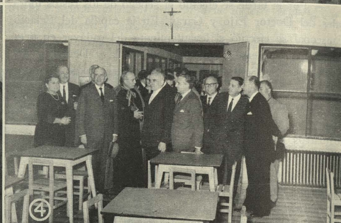
1. Los Ministros, Alcalde y demás autoridades en el grupo escolar del poblado de Fuencarral.—2. En el grupo escolar Regimiento Inmemorial del Rey.—3. Examinando la exposición de material escolar de la escuela de San Cristóbal de los Angeles.—4. Las Autoridades con el Obispo Doctor García Lahiguera en el grupo escolar Estados Unidos

la primera fase del plan general de construcciones escolares fueron inaugurados por los Ministros de Educación Nacional y de la Vivienda, señores Lora Tamayo y Martínez Sánchez-Arjona; Alcalde de Madrid, Conde de Mayalde; Primer Teniente de Alcalde y Delegado de Enseñanza, señor Gutiérrez del Castillo; Director general de Primera Enseñanza, señor Tena Artigas, y otras personalidades. A las cuatro y media de la tarde partió del Ministerio de Educación Nacional la comitiva, que se dirigió en primer lugar al anexionado término de Fuencarral, donde rápidamente visitaron el grupo escolar instalado en aquel poblado. A continuación, los Ministros y demás autoridades inauguraron los grupos del barrio de la Ventilla, Canillas, Gran San Blas, barrio de Valdecánillas y calle de Amposta.