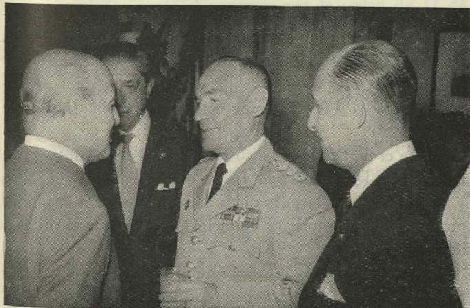
El Alcalde con el General Lindley, ex Presidente de la Junta de Gobierno del Perú

A las nueve de la noche, la Banda Municipal de Madrid dió un nuevo concierto en la plaza inaugurada.