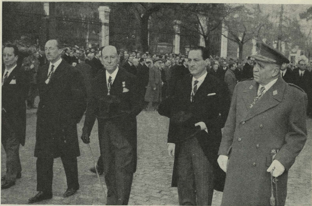
El Alcalde y representación municipal en el entierro del Ministro del Ejército

Día 18.—En el Instituto Municipal de Educación dió comienzo un curso sobre prevención de accidentes infanti-