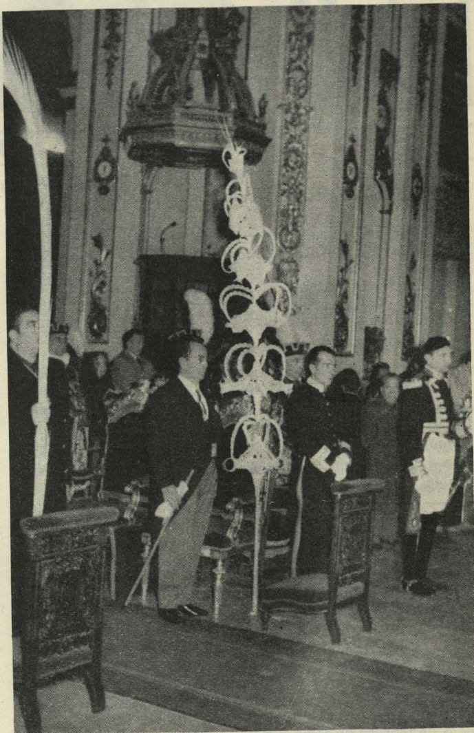
La representación municipal durante la Misa del Domingo de Ramos en la Catedral