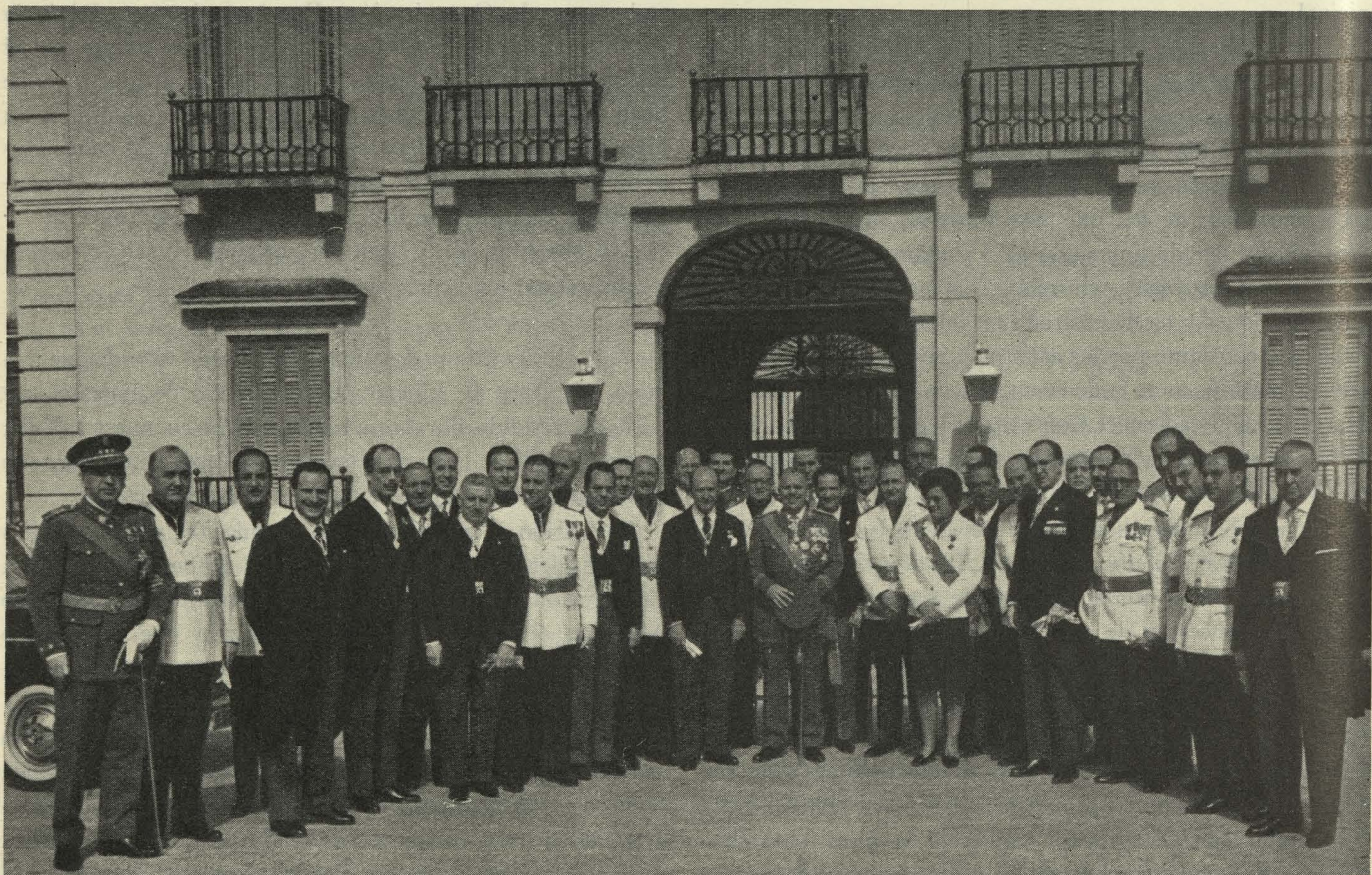
La Corporación Municipal en su visita a Su Excelencia el Jefe del Estado con motivo del XXV aniversario de la Liberación de la capital

Vemos en nuestro Caudillo al primero de los madrileños, residente en El Pardo, hoy anexionado a Madrid, y formando parte de uno de sus distritos; ha sido un auténtico Alcalde, que, como se afirma en la proposición, ha demostrado su gran preocupación siempre por cuantos problemas fundamentales afectan a la Villa. Nosotros, cuantos constituimos la gran familia madrileña, sabemos valorar y apreciar debidamente estos desvelos, de los que nos sentimos orgullosos. Año tras año ha venido ayudando al Ayuntamiento a poner en marcha los proyectos existentes, nos ha dado consejos y orientaciones y ha demostrado un interés excepcional, minucioso y constante por los asuntos y problemas de Madrid, pues su ilusión, como la de cuantos hemos ostentado puestos de responsabilidad en el Concejo, es lograr que Madrid se convierta en una ciudad alegre, limpia y progresiva, digna de ser la capital de nuestra Patria. Su apoyo lo hemos sentido a través de las disposi-