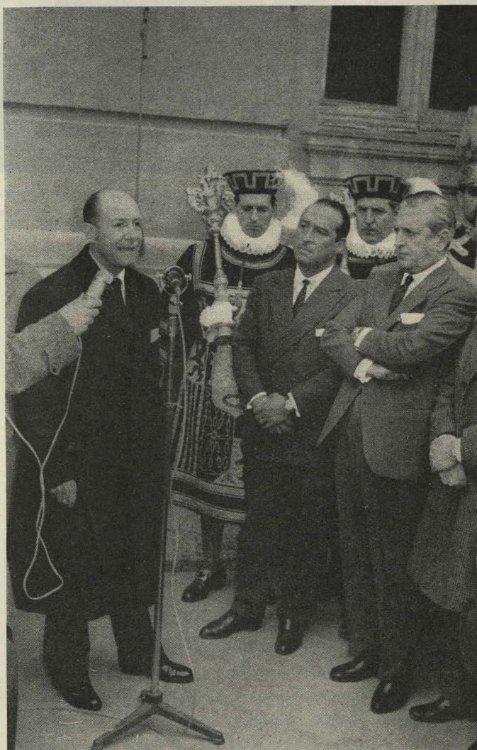
Descubrimiento de una lápida en honor de Agustín de Foxá

— En la casa número 1 de la calle de Ibiza, y por iniciativa de la Sociedad General de Autores de España, fué descubierta una lápida con la siguiente inscripción: "A la memoria del escritor Agustín de Foxá, que vivió y murió en esta casa. 1906-1959. La Sociedad de Autores de España."