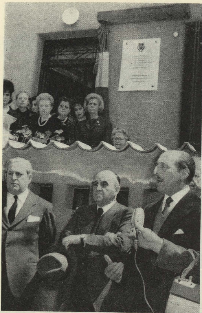
Descubrimiento de una lápida en memoria del maestro Padilla