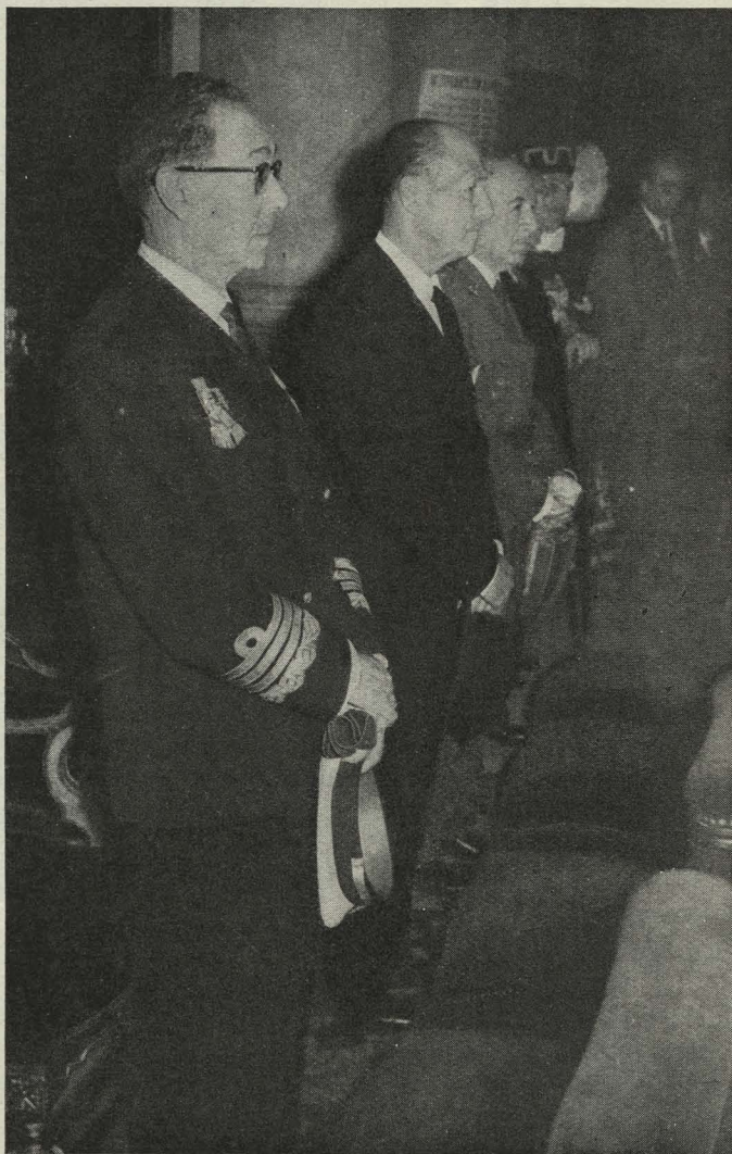
El Conde de Mayalde, con el Ministro de Marina y el Capitán General de Madrid, durante el solemne funeral celebrado en la Almudena por el alma de doña Blanca Escrivá de Romani

— Los artistas que participaban en el Festival de Opera que se celebraba en el teatro de la Zarzuela estuvieron por la mañana en la Casa de la Villa. Fueron recibidos por los