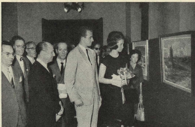
Los Príncipes don Juan Carlos y doña Sofía, acompañados por el Alcalde, inauguran una Exposición de pintura en la Casa de la Panadería