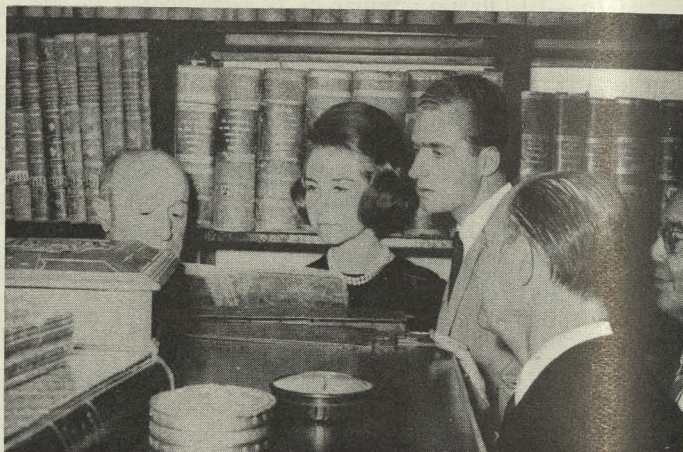
Los Príncipes don Juan Carlos y doña Sofía contemplan el Fuero de Madrid , en el Archivo de Villa

Seguidamente, y por indicación del Conde de Mayalde, se trasladaron al Archivo de Villa, instalado en el mismo edificio, donde el Archivero, don Agustín Gómez Iglesias, les mostró el Fuero de Madrid y otros interesantes documentos históricos que allí se custodian, y de cuya contemplación quedaron altamente complacidos.