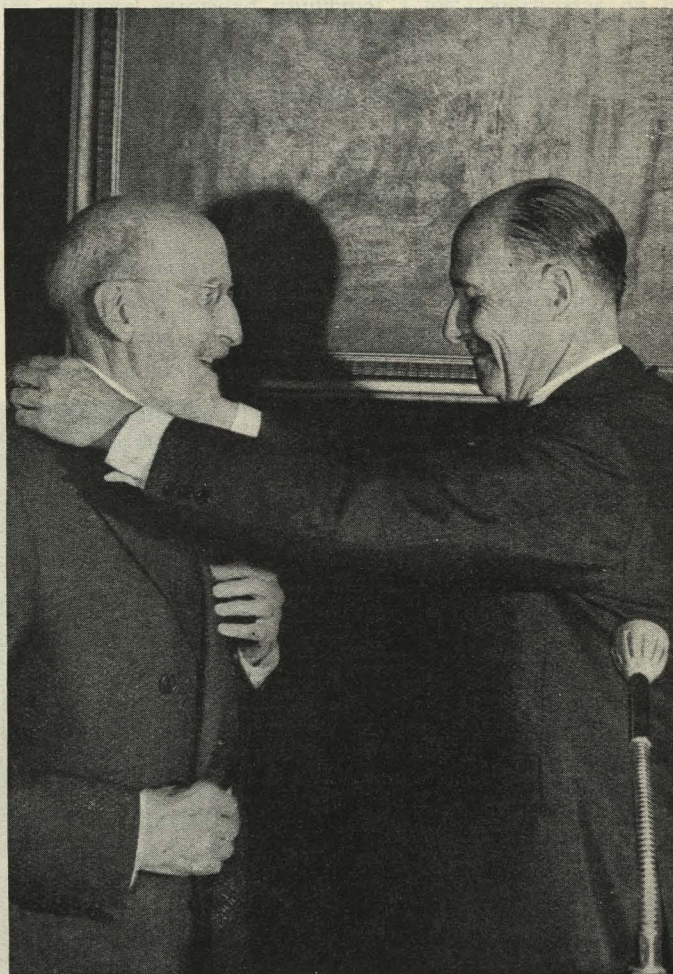
El excelentísimo señor Alcalde imponiendo la Medalla de Oro de la Villa a don Ramón Menéndez Pidal

Este español universal que es don Ramón ha vivido la mayor parte de su vida entre nosotros. En Madrid ejerció su permanente magisterio, y la luz clara que nos