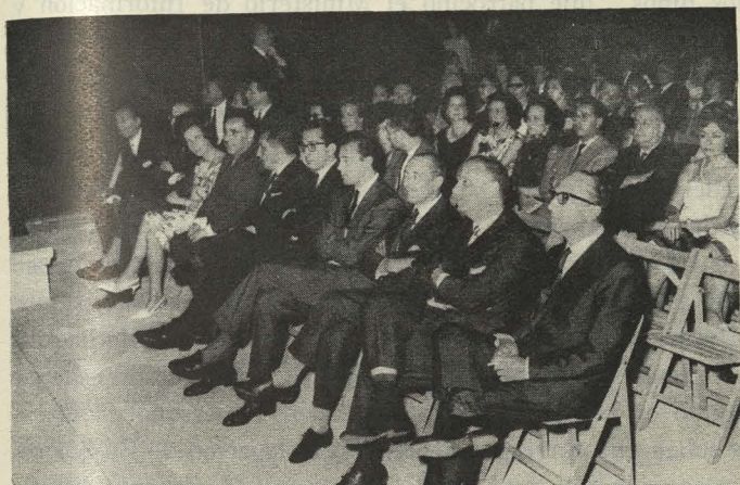
Los Ministros de Información y Turismo y de Trabajo, señores Fraga Iribarne y Romeo Gorría, durante la fiesta celebrada en el Retiro con motivo de la entrega de los premios de Radio y Televisión