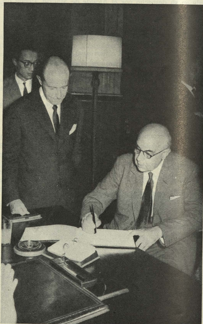
El premio Nobel de Literatura don Jorge Seferis, firma en el Libro de Oro del Ayuntamiento