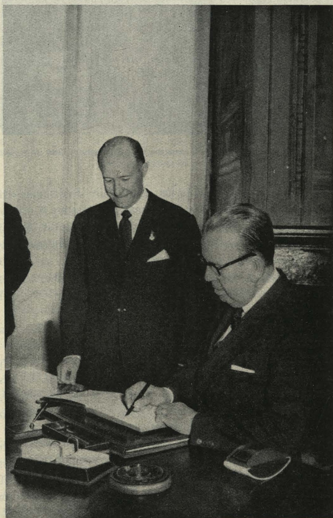
El Ministro turco de Negocios Extranjeros firma en el Libro de Oro de la Villa, en presencia del Alcalde