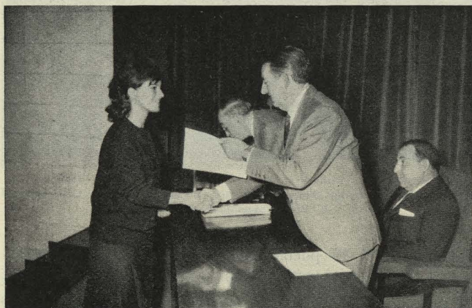
Entrega de premios a los escolares participantes en el IX Concurso Infantil de Pintura y Dibujo al aire libre

—Con motivo de las fiestas de San Isidro, el Instituto Municipal de Educación convocó el IX Concurso Infantil