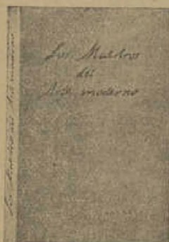
Reproducción reducida de un tomo encuadernado.

En tela, con planchas, aumenta el precio 1,20 ptas. por tomo