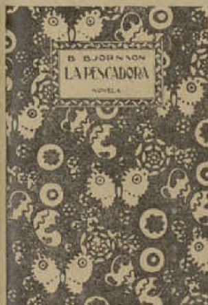
Muestra reducida de una cubierta

OBRAS LITERARIAS Y ENTRE ELLAS LAS SIGUIENTES