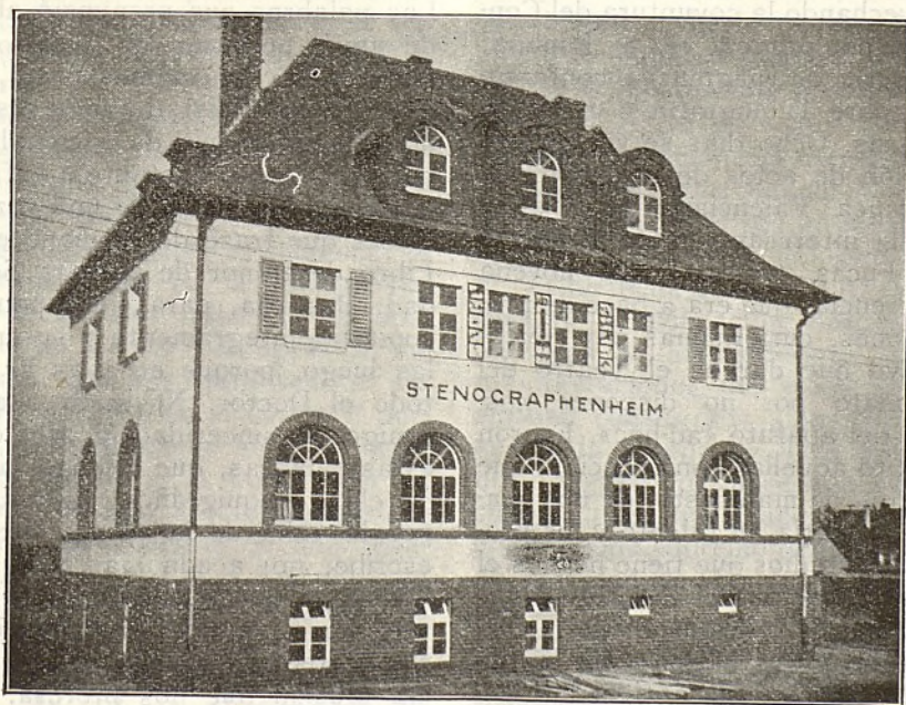
Casa propia de los taquígrafos de Siegmar (Alemania)