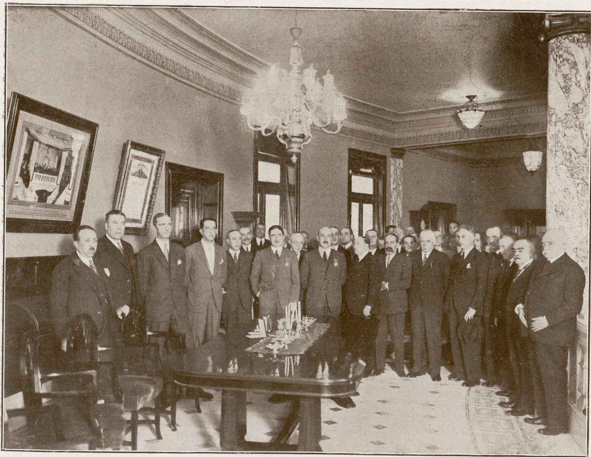
En el Palacio de la Equitativa (Fundación Rosillo)