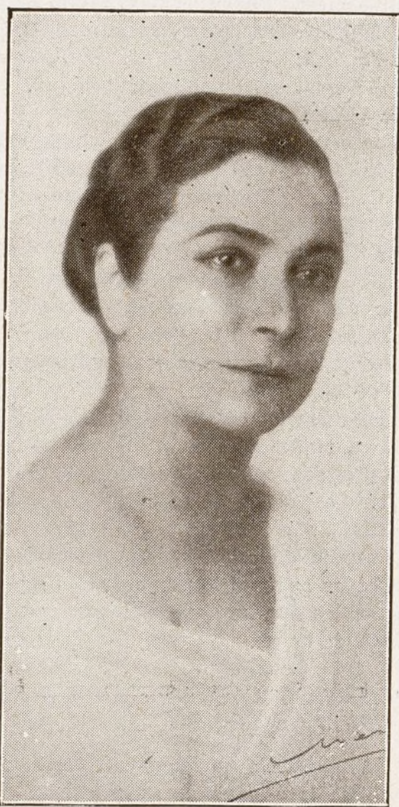
La eminente actriz Margarita Xirgu, que disfruta de grandes simpatías en la Corte.

El día 28 hará su debut en el teatro de Maravillas una gran compañía de que abandona de nuevo el verso para volver a la zarzuela, donde le esperan tan grandes éxitos como en sus pasa-