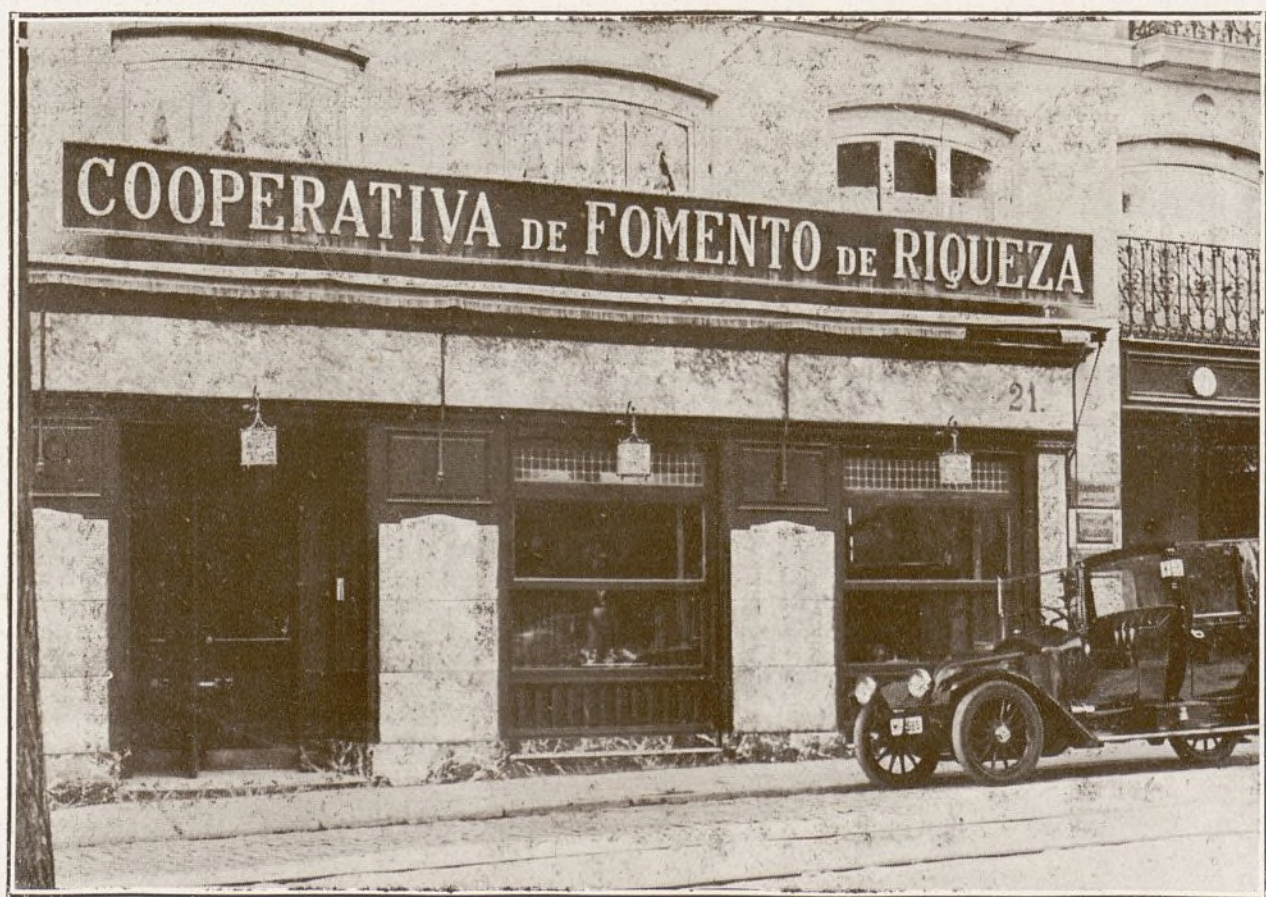
Local donde se hallan instaladas las oficinas en el Paseo de Recoletos, 21.