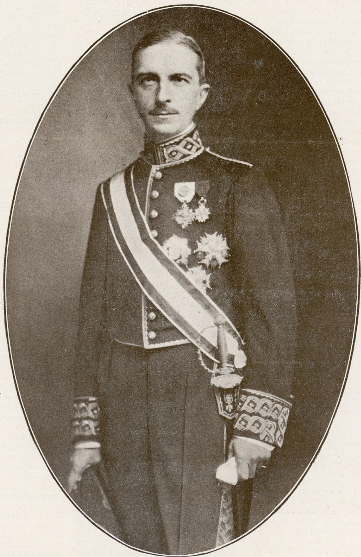
Excmo. Sr. Don Pedro Sangro y Ros de Olano, marqués de Guad-el-Jelú Ministro de Trabajo y Previsión.