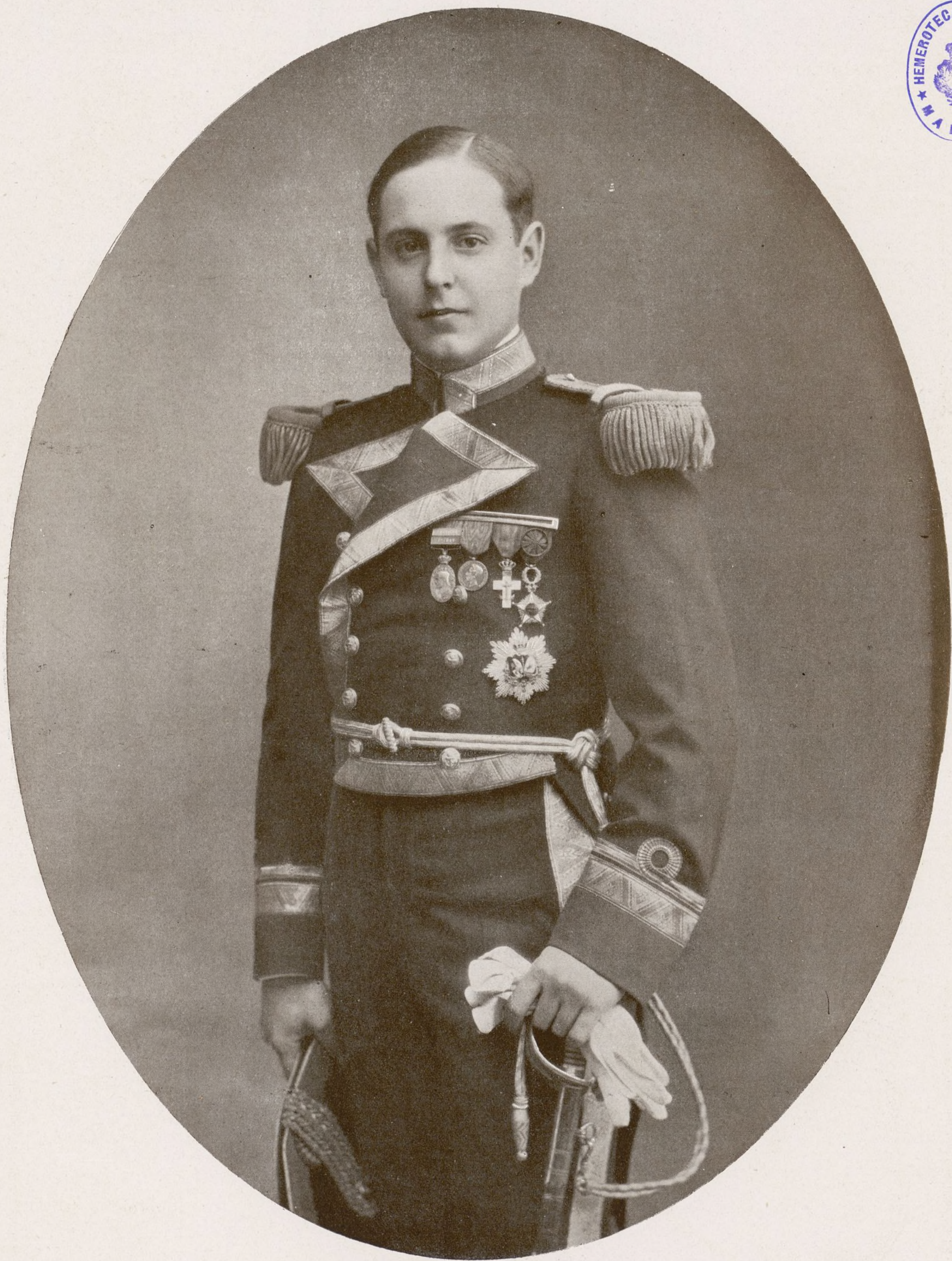
Excmo. Sr Marqués de Viana y Conde de Urbasa

a quien dirigieron un mensaje de gratitud ensalzando la generosidad del ilustre y joven aristócrata, la Federación Católica Agraria de Avila y el Sindicato Agrícola de Solosancho, por haber vendido a sus colonos (con gran pérdida para los intereses del ilustre prócer), una extensión superficial de más de 5.000 hectáreas con 714 edificios, condonándoles también las rentas que le adeudaban. Tal rasgo merece la consideración y el aplauso de todos, y el nuestro muy afectuoso.