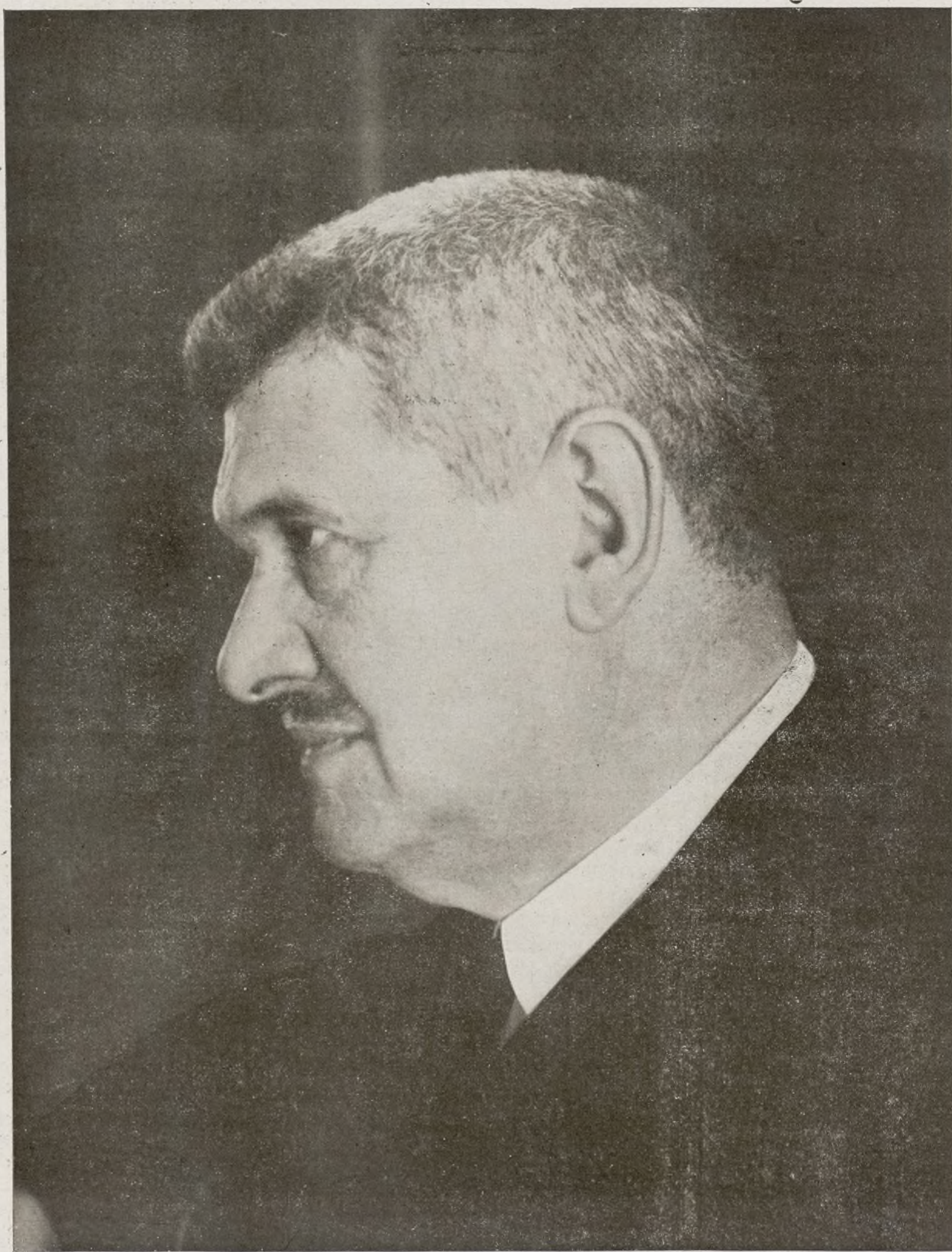
Excmo. Sr. D. Jaime Carner Ministro de Hacienda