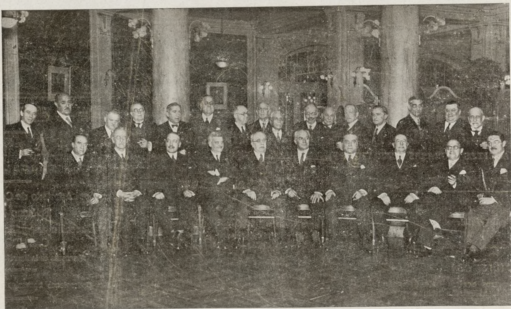
Grupo de las personalidades de la Banca que asistieron al Banquete con que obsequió el Consejo Superior Bancario, al Jefe del Gobierno y al Ministro de Hacienda