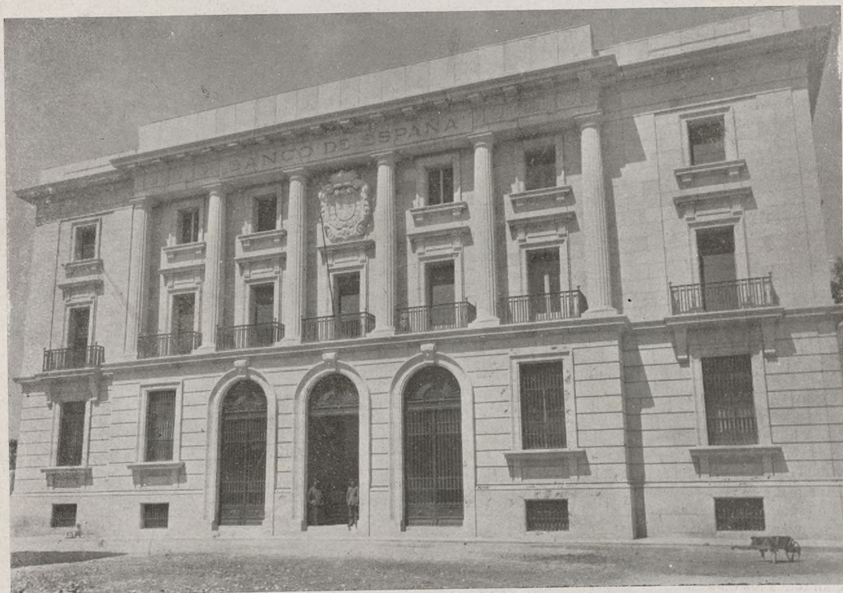
EDIFICIO DE LA "SUCURSAL" DEL BANCO DE ESPAÑA EN ÁVILA