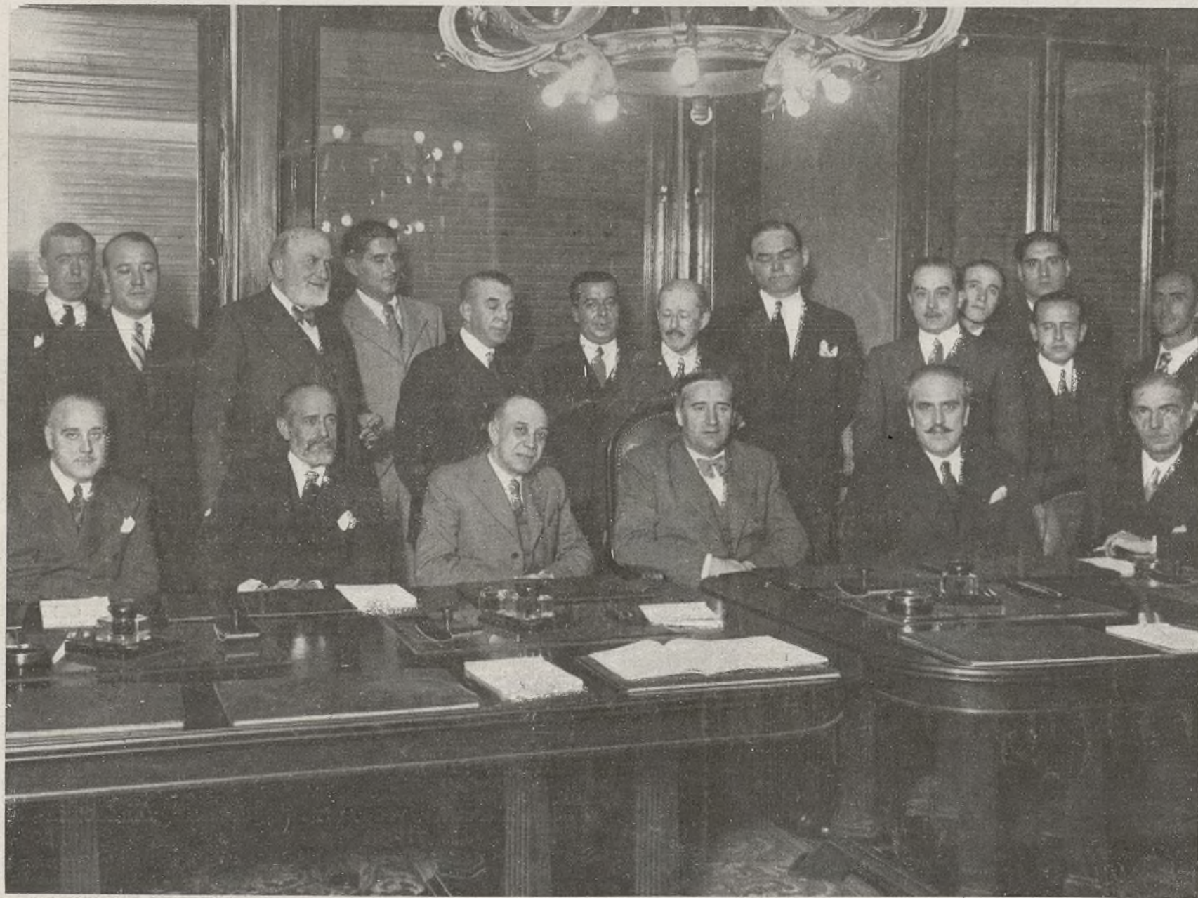
Excmo. Sr. Ministro de Trabajo y otras personalidades en el Instituto de Crédito de las Cajas generales de Ahorro.