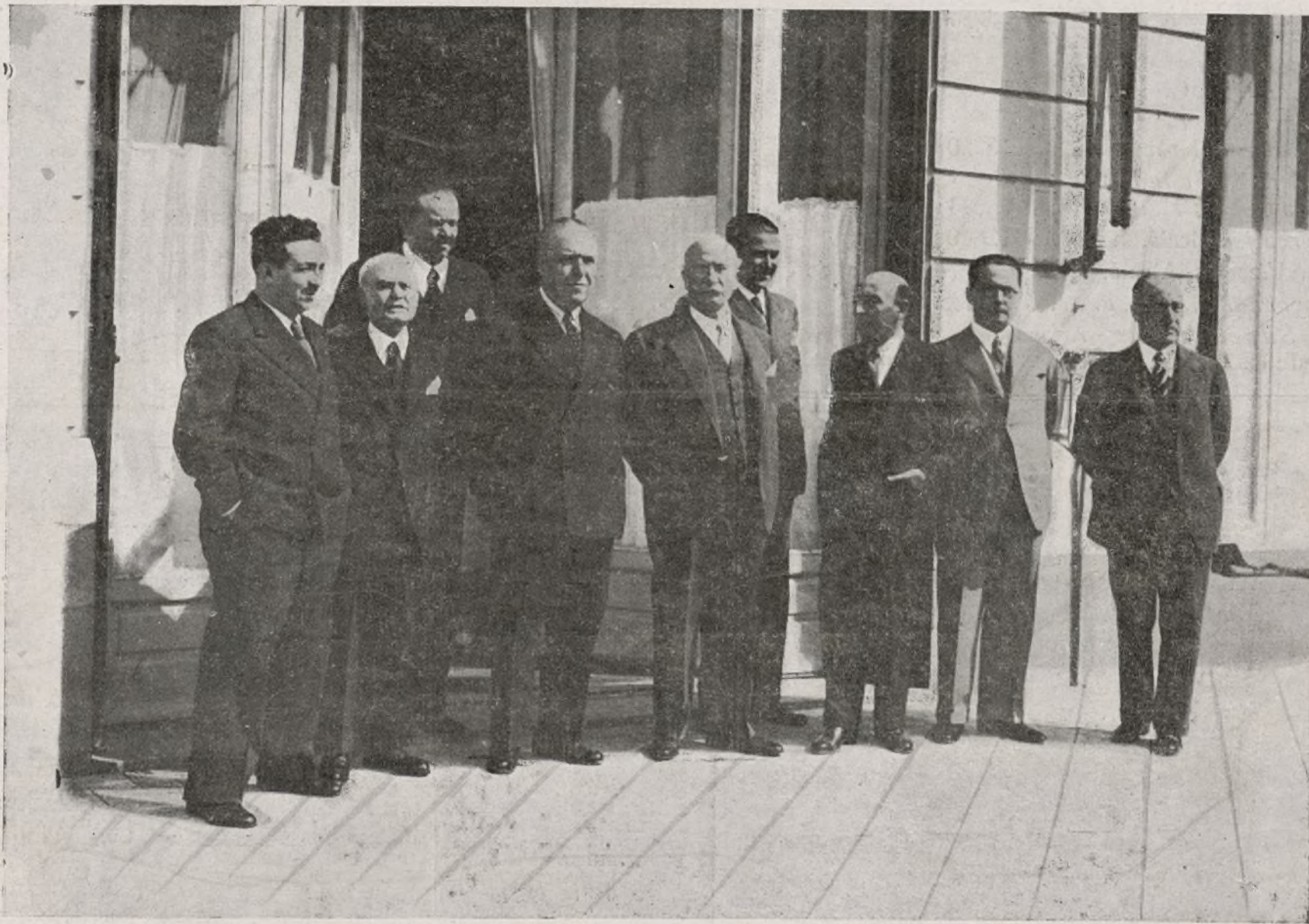
Reunión del Presidente del Gobierno, Sr. Samper, y de los ministros radicales, con su ilustre jefe, D. Alejandro Lerroux.