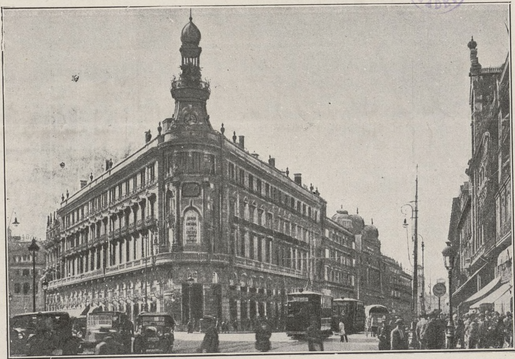
Madrid. Banco Español de Crédito.