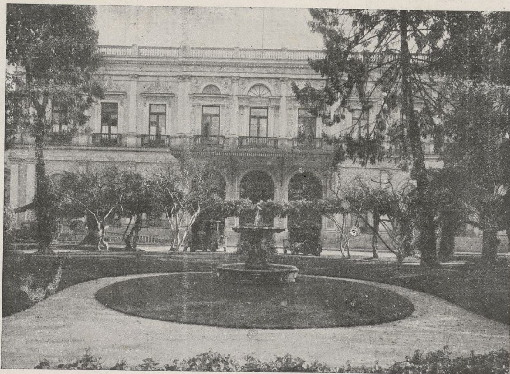
Madrid, Banco Hipotecario de España.