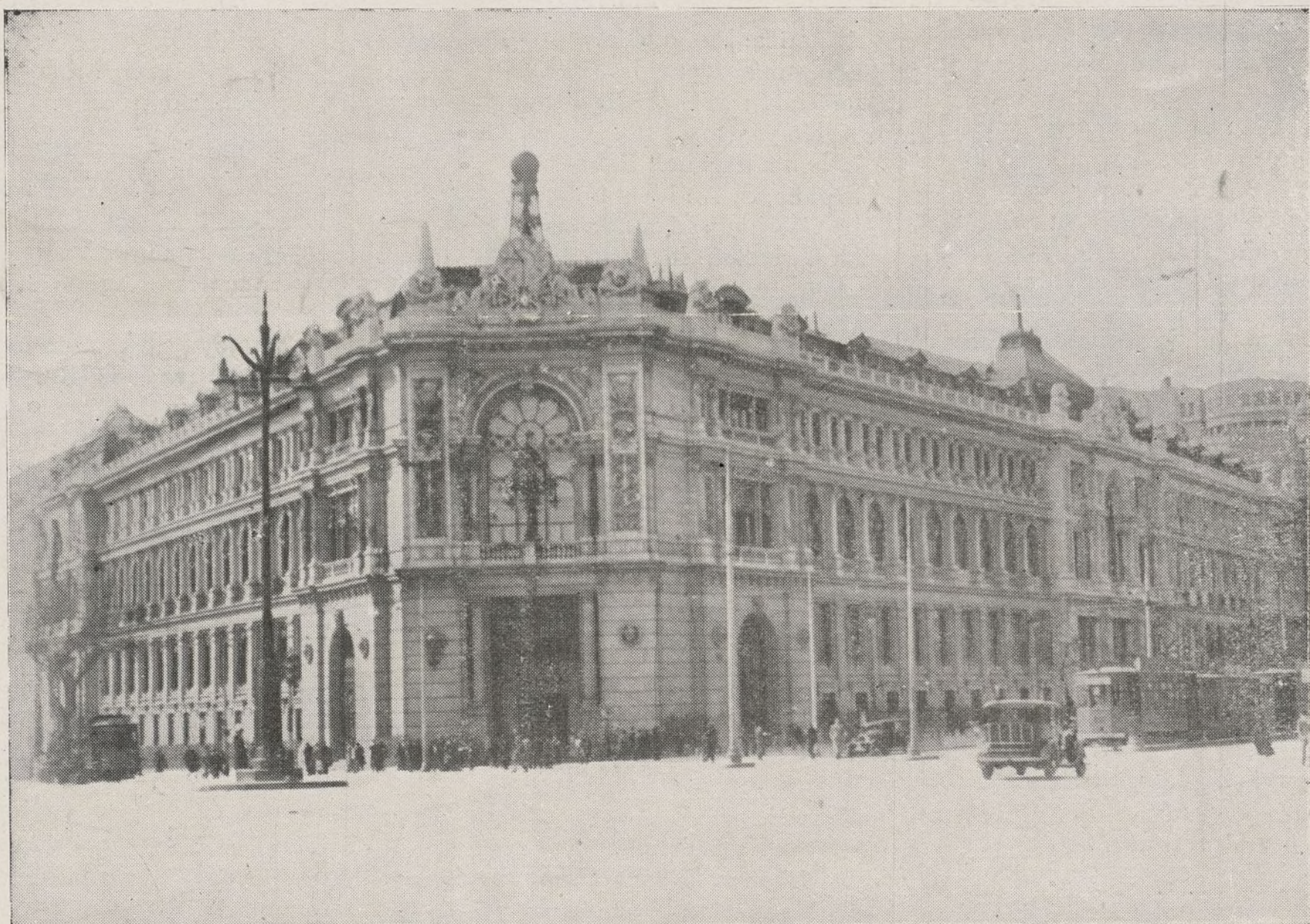
Madrid. Banco de España.

DOMICILIO PROVISIONAL: CALLE DE FRANCISCO FERRER, 8, 1.º IZQDA. (Antes Avenida de la Plaza de Toros) MADRID