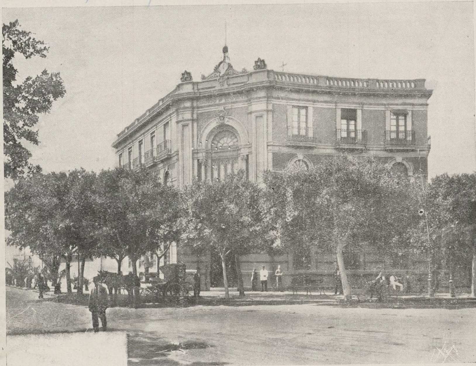
Sucursal del Banco de España en Almería.

DOMICILIO PROVISIONAL: CALLE DE FRANCISCO FERRER, 8, 1.º IZQDA. (Antes Avenida de la Plaza de Toros) MADRID