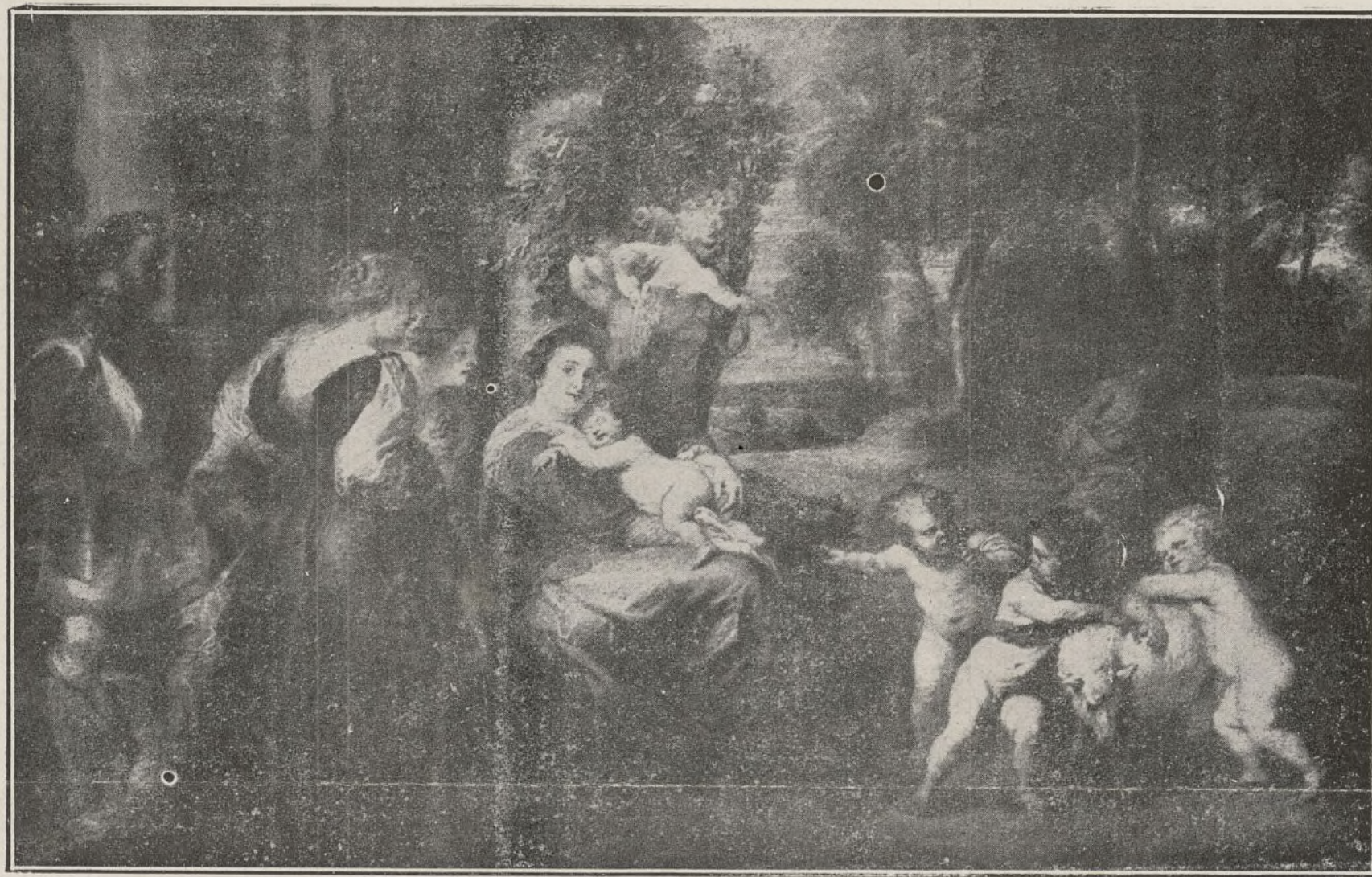
CUADROS DEL MUSEO (Rubens).

DOMICILIO PROVISIONAL: CALLE DE FRANCISCO FERRER, 8, 1.º IZQDA. (Antes Avenida de la Plaza de Toros) MADRID