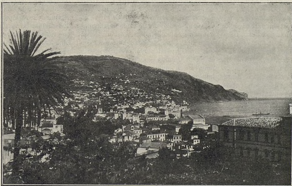
FUNCHAL. — Vista oriental de la capital de la Isla Madera.

Una obra que se ha iniciado hace pocos años en Portugal, y que está despertando gran interés, aun fuera del país, es la que se hace a favor de los presos en las cárceles de Lisboa, Oporto y Coimbra.