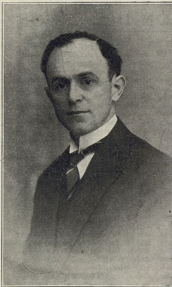
Ofrezco este sermón a mis hermanos españoles, como mi sincero homenaje, deseando que Dios se sirva de él para la salvación de muchas almas en el país hermano. — P. L. P.

dió: «Cuando oráreis, decid: Padre nuestro que estás en los cielos...» Si aquellos alguaciles que fueron, cierta vez, a prender a Jesús, hubieran oído esas palabras, hubieran dicho nuevamente: «¡Nunca hombre alguno habló como este hombre!». Sí, porque pertenece al Señor Jesucristo la gloria de haber dado al mundo la verdadera idea de Dios, esto es, que Él