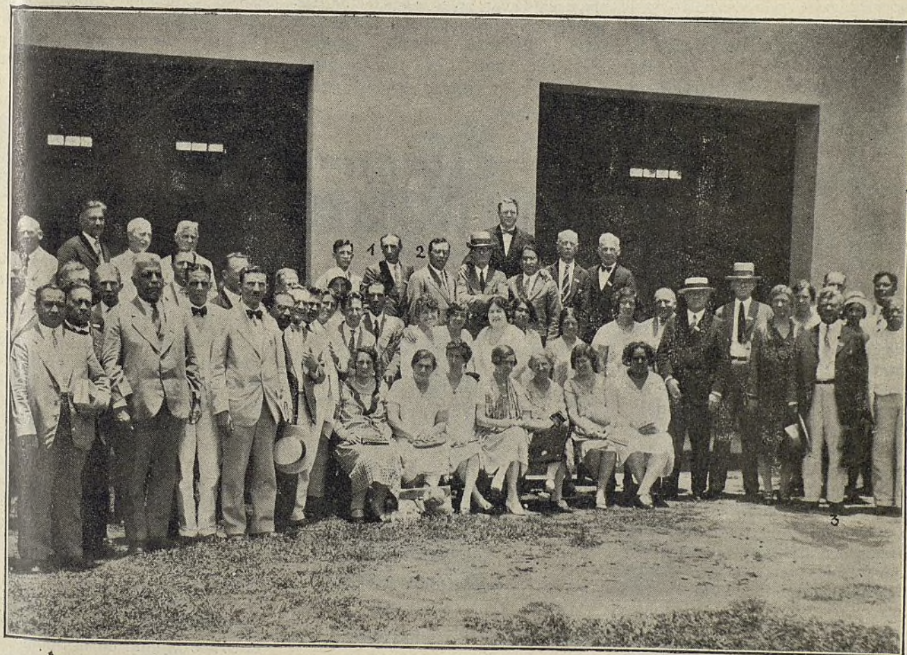
UN GRUPO DE DELEGADOS AL CONGRESO DE LA HABANA

En la ciudad de La Habana, y en el hermoso templo de la Iglesia Metodista Episcopal del Colegio Candler, celebró su primera sesión, a las ocho y media de la mañana del 21 de Junio de 1929, el Congreso Evangélico Hispanoamericano.